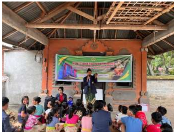
Gambar 2. Materi Pentingnya Menabung Sejak Dini

diberi penjelasan dan pemahaman tentang pentingnya menabung, seperti melalui sosialisasi yang tepat sejak dini. Selain itu, anak-anak juga perlu didorong agar tertarik menabung. Salah satu cara memotivasi anak untuk gemar menabung adalah dengan melibatkan kreativitas mereka, misalnya membuat celengan dari benda-benda bekas seperti botol (Sugiarto et al., 2024).