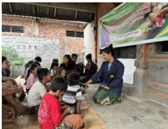
Gambar 4. Implikasi Menabung Sejak Dini

Pengenalan kebiasaan menabung sejak dini memberikan dampak jangka panjang yang sangat signifikan, baik dari sisi individu maupun masyarakat secara luas. Pada tingkat individu, menabung menjadi fondasi penting dalam pembentukan literasi keuangan yang sehat. Anak-anak yang sejak kecil dibiasakan menyisihkan sebagian uang jajannya untuk ditabung cenderung memiliki kemampuan mengatur pengeluaran, menghindari perilaku konsumtif berlebihan, dan merencanakan masa depan dengan lebih matang. Proses ini melatih mereka untuk memahami konsep nilai uang, perbedaan antara kebutuhan dan keinginan, serta pentingnya perencanaan keuangan. Dengan membentuk kebiasaan menabung sejak dini, diharapkan dapat membantu mengubah pola pikir dan perilaku siswa dalam mengelola keuangan secara bijaksana serta membantu meningkatkan kesejahteraan ekonomi masyarakat di masa depan (Kurnia, Kia, Kisanjani, Rahman, & Puji, 2024).