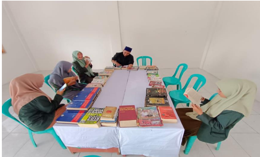
Gambar 11. Tim pemberdaya memindahkan buku layak baca ke balai desa Sooko, Wringinanom Gresik

Pada hari Selasa, 30 Agustus 2022 pukul 09.00, pemberdaya memindahkan buku layak baca ke balai desa Sooko, Wringinanom Gresik setelah menyiapkan meja dari papan kayu dan beberapa kursi untuk duduk.