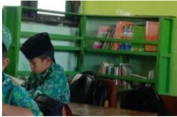
Gambar 4. Observasi ke lembaga pendidikan desa Sooko

Gambar diatas menunjukkan keadaan awal rak buku beserta isi bukunya di lembaga pendidikan Sooko. Dari segi rak, terlihat sudah kusam dan catnya banyak yang terkelupas. Sedangkan dari segi buku, hanya berisi beberapa buku saja di satu sisi, dan sisi satunya belum terdapat buku.