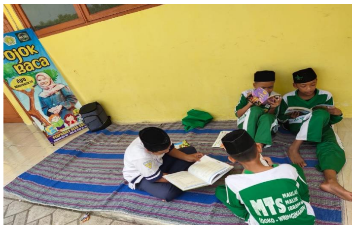
Gambar 7. Siswa MTs Maulana Malik Ibrahim desa Sooko membaca buku diluar kelas

Kegiatan pojok baca oleh ibu-ibu posyandu dilaksanakan pada tanggal 12 Agustus 2022 pukul 09.00-selesai yang ditempatkan di balai dusun Sooko, Wringinanom Gresik, Dari kegiatan tersebut, kalangan ibu-ibu akhirnya mengetahui adanya program dari tim pemberdaya dan mendukung adanya hak itu.