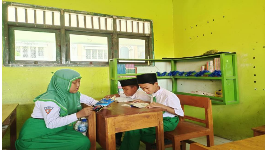
Gambar 8. Kegiatan membaca buku oleh MI Miftahul Ulum Sooko, Wringinanom Gresik.

disediakan oleh tim pemberdaya masyarakat sembari menunggu giliran pemeriksaan kesehatan keliling yang berkontribusi dengan Yayasan Yatim Mandiri pada tanggal 23 Agustus 2022 pukul 09.00-selesai dan bertempat di TK Dharma Wanita.