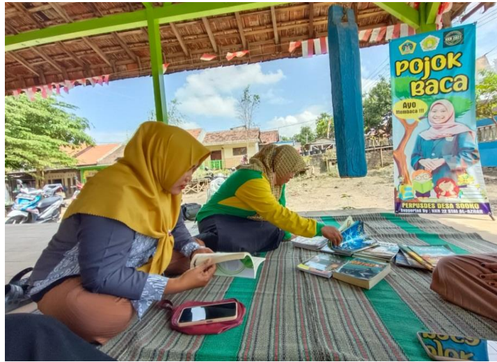
Gambar 6. Ibu-ibu posyandu membaca buku sembari menunggu giliran tiba

pendidikan Indonesia, karena menambah ilmu pengetahuan diawali dari membaca. Tanpa membaca, tidak bisa menulis dengan baik, begitu juga sebaliknya.