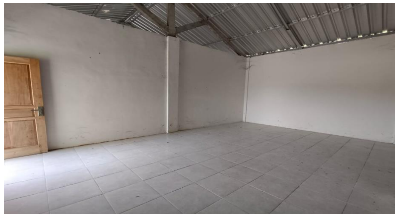
Gambar 5. Observasi ke balai desa desa Sooko

Gambar diatas menunjukkan keadaan awal rak buku beserta isi bukunya di lembaga pendidikan Sooko. Dari segi rak, terlihat sudah kusam dan catnya banyak yang terkelupas. Sedangkan dari segi buku, hanya berisi beberapa buku saja di satu sisi, dan sisi satunya belum terdapat buku.