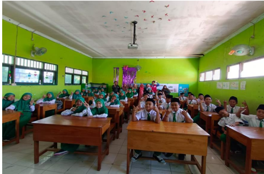
Gambar 12. Tim pemberdaya masyarakat bersama tim Yayasan Yatim Mandiri siswa-siswi Miftahul Ulum Sooko, Wringinanom Gresik

Dari foto diatas, dapat diketahui bahwa tim pemberdaya masyarakat foto bersama setelah pelaksanaan sosialisasi terkait penguatan literasi di lembaga MI Miftahul Ulum yang dimulai pada pukul 09.00-selesai bersama Yayasan Yatim Mandiri