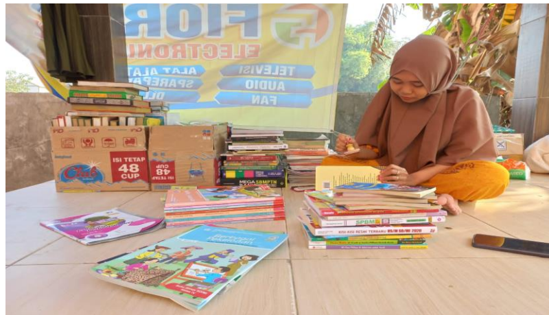
Gambar 10. Tim pemberdaya menstempel buku layak baca

Berdasarkan foto diatas, kegiatan inventarisasi buku layak baca dilakukan oleh tim pemberdaya sebelum distempel dan diserahkan pada lembaga pendidikan dan balai desa Sooko. Kegiatan tersebut dilakukan pada tanggal 08 Agustus 2022 pukul 18.30-selesai. Kegiatan inventarisasi ditujukan agar buku sebagai bahan perpustakaan memiliki data.