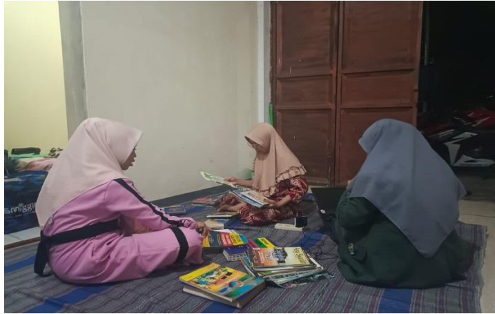
Gambar 9. Inventarisasi buku layak baca

terkumpul sudah mencukupi, barulah memindahkannya ke lembaga pendidikan dan balai desa Sooko, karena disana terdapat rak buku dengan buku seadanya, jadi pelaku pemberdaya merenovasi dan menambahkan buku-buku layak baca agar Pojok Baca terlaksana dengan baik.