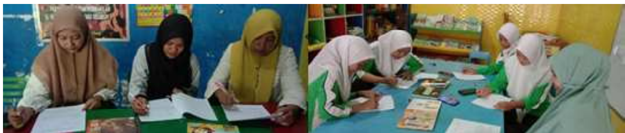
Gambar 3. Evaluasi UEQ ARCS Timun Mas oleh beberapa informan (Sumber: Data primer diolah, tahun 2024)

Setelah proses pengisian kuesioner yang berlangsung selama 5-10 menit, dapat dilihat ringkasan data kuesioner pada Tabel 2 yang menunjukkan bahwa diperoleh hasil rata-rata sebesar 87% dari hasil evaluasi media dengan menggunakan kuesioner UEQ. Penilaian tertinggi hingga mencapai 100% terdapat pada indikator daya tarik visual dan inovasi media. Hal ini sesuai dengan penelitian terdahulu yang dilakukan oleh Nengsih dkk. (2023) pada media pembelajaran menggunakan augmented reality yang juga memiliki tingkat validitas tertinggi hingga mencapai 90% dari media konvensional. Hal ini menunjukkan bahwa media memiliki daya tarik visual dan konsep yang inovatif menurut para informan. Hasil terendah terdapat pada indikator simulasi teknologi dengan 67% informan menerima teknologi AR dan sisanya merasa kesulitan dalam penggunaannya. Setelah kuesioner diisi, peneliti melakukan wawancara dengan membahas masing-masing indikator penilaian UEQ guna memperoleh hasil yang lebih mendalam terkait evaluasi yang telah dilakukan.