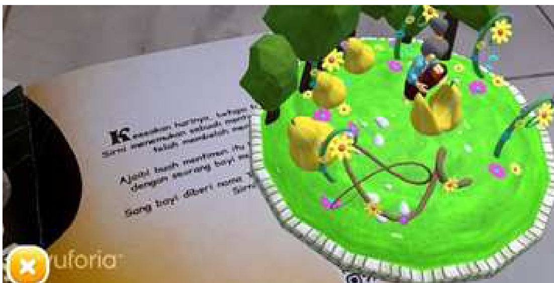
Gambar 1. Adegan animasi 3D pada ARCS Timun Mas

ARCS Timun Mas memanfaatkan teknologi augmented reality untuk meningkatkan pengalaman membaca. Teknologi ini menggabungkan objek virtual, seperti animasi 3D, dengan lingkungan fisik buku cetak. Pemilihan augmented reality didasarkan pada meluasnya penggunaan dan keakraban telepon pintar, yang berfungsi sebagai alat akses untuk teknologi ini. Dengan memindai penanda, dalam bentuk barcode menggunakan smartphone, pengguna dapat memunculkan aset augmented reality seperti animasi dan narasi audio. Untuk memastikan bahwa anak-anak tidak terlalu terganggu oleh telepon pintar, penanda hanya disertakan pada halaman tertentu. Pendekatan ini memungkinkan keseimbangan antara penggunaan teknologi dan konten buku cetak, membuat pengalaman membaca lebih menarik bagi anak-anak.