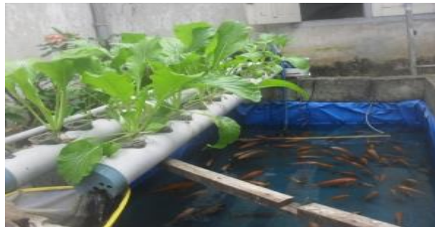
Gambar 1. Model Aquaponik NFT

diawali dengan pembangunan atau pembuatan kolam penampung ikan selanjutnya dilanjutkan dengan mengatur pompa dan timer serta pipa PVC yang digunakan untuk meletakkan tanaman dengan menggunakan metode NFT. Dalam Akuaponik NFT, fungsi filter sangat penting. Terutama untuk filter kotoran padat agar tidak mengganggu pertumbuhan tanaman dalam sistem akuaponik. Selain itu, biofilter berfungsi untuk mengurai kotoran yang tidak bisa terserap oleh tanaman.