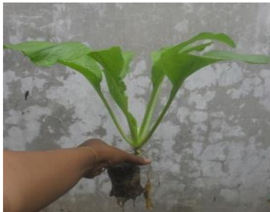
Gambar 3. Aquaponik NFT kolam terpal sawi

Berdasarkan gambar 3 diatas, merupakan hasil dari aquaponik sederhana dengan menggunakan metode aquaponic NFT. Adapun cara pembuatan aquaponik sederhana yaitu Rendam sayuran sawi semalaman, selanjutnya menggunakan media potongan tali rafia. Pembatasnya menggunakan plastik tebal yang dilubangi menggunakan bor. Untuk pipa yang digunakan sebaiknya berukuran 1 inci. Adapun perawatan yang dilakukan cukup menguras filter seminggu sekali dengan cara membuka saluran kuras dan mengaduk potongan tali rafia. Yang perlu diperhatikan adalah bahwa biofilter ini akan bekerja optimal setelah proses cycling selama kurang lebih beberapa minggu. Setelah pipa sirkulasi dapat berfungsi, bibit ikan dapat diletakkan pada kolam dan tanaman yang telah disemai sebelumnya dan telah menjadi bibit, dapat diletakkan pada pipa tanam. Wadah pemeliharaan ikan atau kolam ikan adalah satu hal yang penting dalam sistem akuaponik. Kolam ini digunakan untuk menampung ikan sekaligus air yang nantinya akan dialirkan pada tanaman. Kolam atau wadah pemeliharaan ikan dapat dibangun sesuai dengan luas lahan dan kondisi lingkungan. Kolam ini juga akan mempengaruhi panjang pipa PVC atau wadah tanaman yang akan digunakan untuk budidaya hidroponik.