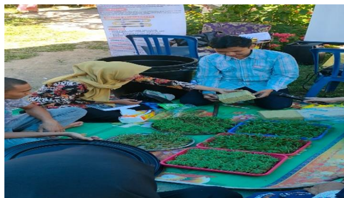
Gambar 2. Sosialisasi Pembuatan Aquaponik Sederhana

Kegiatan sosialisasi dan pelatihan pembuatan aquaponik sederhana dilakukan pada hari Sabtu, 23 Juli 2022 di Desa Bilacaddi.