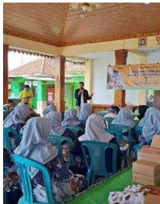
Gambar 5. Narasumber memberikan edukasi bijak bersosial media