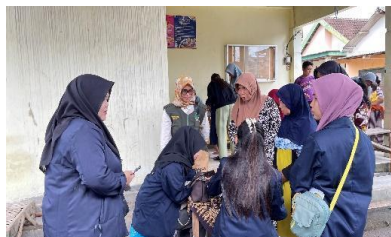
Gambar 3. Proses Observasi