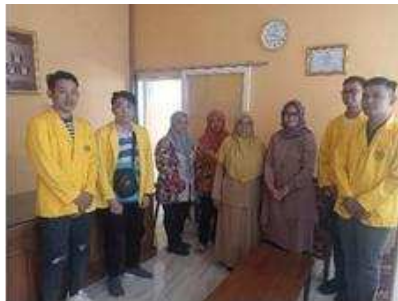
Gambar 2. proses koordinasi dengan perangkat desa