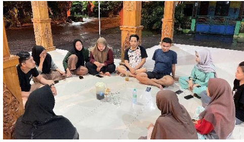
Gambar 4. proses diskusi dan persiapan oleh tim