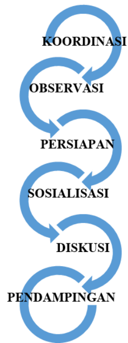
Gambar 1. Kerangka Tahapan Sosialisasi