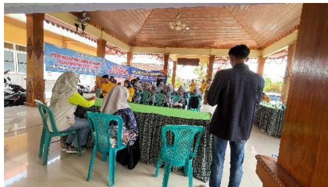
Gambar 6. Sesi diskusi/tanya jawab terkait materi