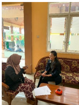
Gambar 7. Kegiatan Monitoring