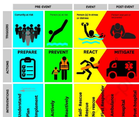
Gambar 3. Drowning timeline 6

kunci yang memastikan aktivasi dini penyelamatan profesional dan layanan medis. Berikan pelampung kepada korban, hentikan proses tenggelam dengan mengurangi risiko tenggelam. 4 Personel wajib mengambil tindakan pencegahan untuk tidak menjadi korban lain dengan memberikan respon penyelamatan yang tidak tepat atau berbahaya. Apabila proses tenggelam tidak diintrupsi, maka korban dapat tidak sadarkan diri dan apnea, kemudian diikuti oleh henti jantung. 6