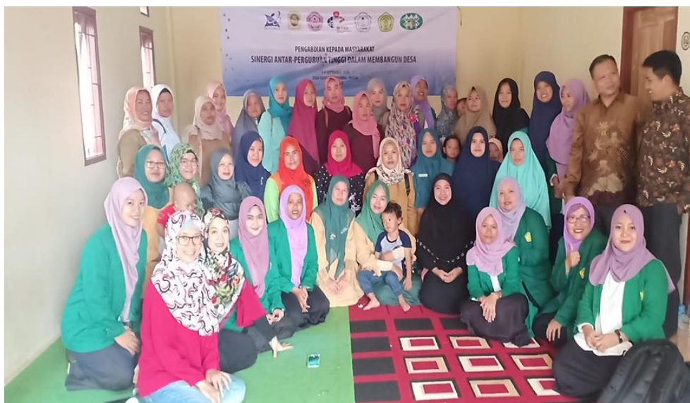
Gambar 4. Foto bersama setelah selesai pelatihan dihari kedua

Pada akhir pertemuan dihari kedua, kami sempatkan berfoto bersama sebagai bukti laporan PkM dan tentunya menjadi kenang-kenangan bagi kami semua.