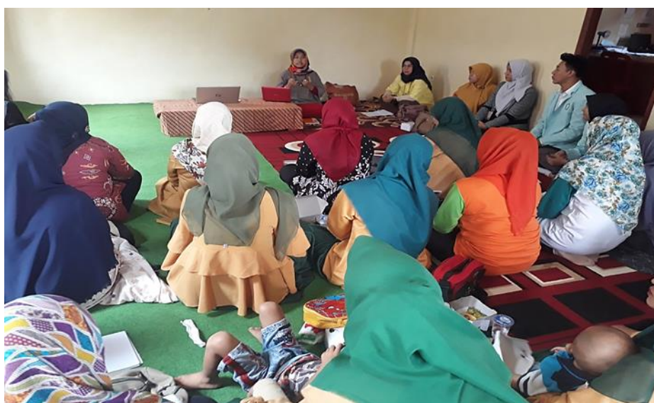
Gambar 2. Suasana pretes secara lisan

Berdasarkan hasil pretest diawal kegiatan pelatihan, 19 orang yang berasal dari 12 PAUD yang berbeda menyatakan belum membuat program semester sendiri. Sekalipun mereka pernah mendapatkan pelatihan membuat program semester dari organisasi profesi yang ada di Kecamatan Ciadeg. Namun masih belum mampu membuat adminitrasi pembelajaran. Ketika ditanyakan alasannya, mereka menjawab pada saat pelatihan belum melakukan praktik yang dibimbing pakar. 6 peserta yang berasal dari 4 lembaga PAUD sudah meyusun sendiri program semesternya, namun mereka belum yakin yang dibuat sudah layak digunakan atau diimplementasikan. Suasana pretes sebelum materi disampaikan narasumber pertama.