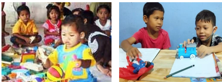
Gambar 1. Suasana belajar anak-anak pada dua PAUD di Desa Ciadeg yang belum terarah

Masalah kekurangan tenaga pendidik PAUD juga terjadi di Kelurahan Cigombong, Kecamatan Ciadeg, Kabupaten Bogor. Dari hasil observasi awal berdasarkan laporan alumni PAUD yang pernah melaksanakan PPL di kelurahan Cigombong, ada beberapa lembaga PAUD yang tenaga pendiknyanya masih belum mampu menyusun rencana pembelajaran dengan baik dan benar di desa Ciadeg, padahal RPP merupakan hal penting yang harus dipahami dan dikuasai oleh pendidik khususnya pendidik anak usia dini. Selain itu mereka kurang memahami karakteristik perkembangan anak dan proses pembelajaran yang mereka lakukan belum sesuai dengan Permendiknas No. 58 tahun 2009. Kurangnya pengetahuan mereka terhadap perkembangan anak membuat suasana belajar terkesan sangat monoton dengan kegiatan yang juga kurang sesuai dengan kebutuhan anak usia dini. Berdampak pembelajaran yang diterima anak kurang membangun kreativitas dan kurang membangun tumbuh kembang perilaku anak. Pembelajaran kurang inovatif dan suasana belajar terlihat kurang menarik bagi anak-anak. Lebih terkesan guru memberikan kebebasan yang kurang terarah, pada saat belajar menulis seperti tampak pada Gambar 1.