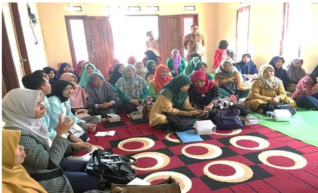
Gambar 3. Suasana praktik diakhir hari kedua memanfaatkan Gadget (HP)

Pada pelatihan ini, peserta pelatihan diperagakan cara membuat media pembelajaran dengan material yang ada disekitar dan terjangkau namun menarik dan dengan media tersebut membuat anak lebih senang untuk belajar. Ada juga narasumber yang mengajarkan mencari media pembelajaran melalui gadget (HP). Suasana pelatihan saat memanfaatkan gadget atau HP terlihat sebagai berikut: