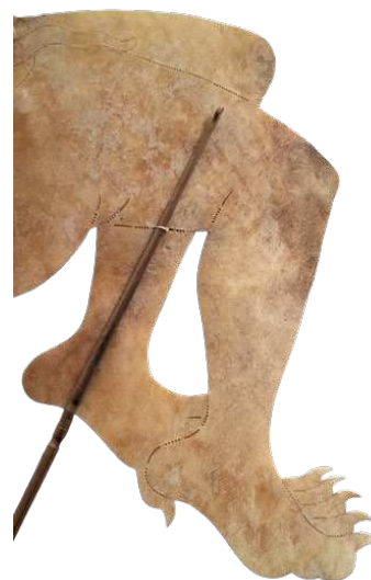
Gambar 4. Bagian kaki wayang setan Mahakali

beberapa eksperimen sehingga menemukan titik kenyamanan dalam menggerakkan wayang setan Mahakali.