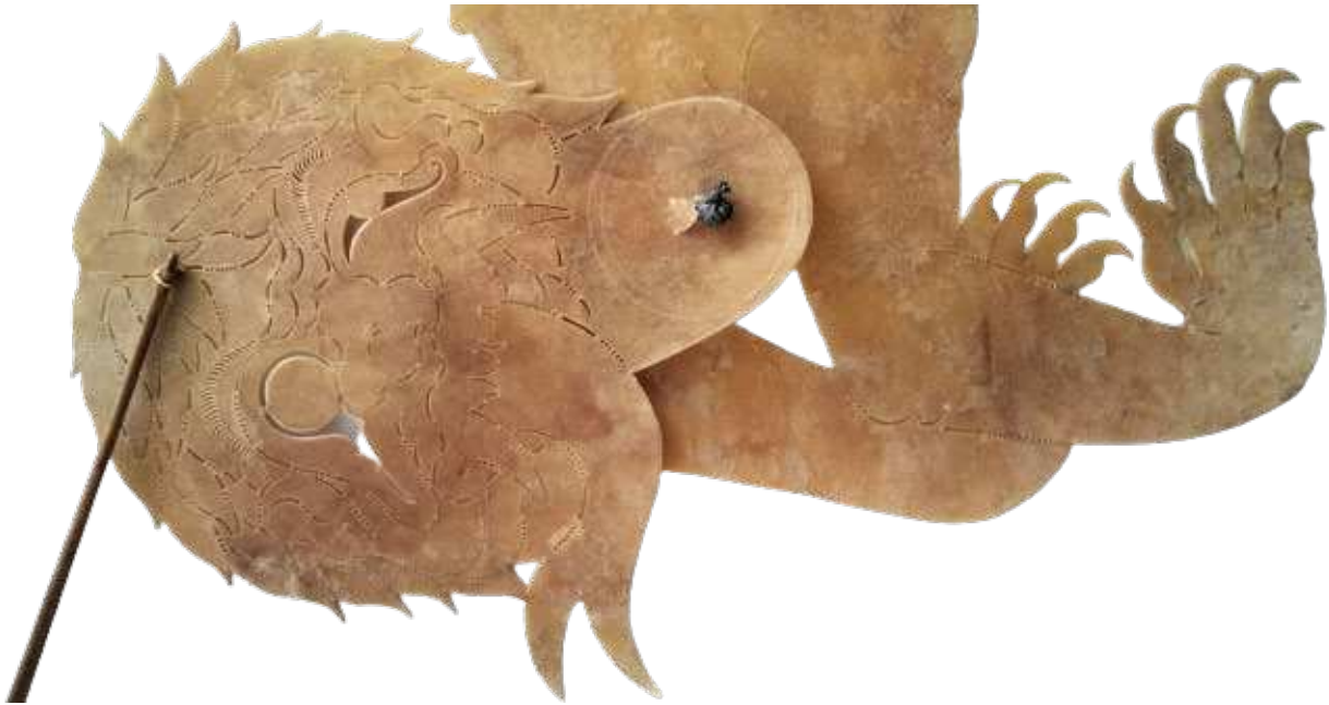
Gambar 3. Bagian kepala wayang setan Mahakali

Teknik menggerakkan wayang ini juga mengalami eksplorasi, dimana tuding (tunggai penggerak wayang) dipasang pada kepala dan kaki saja. Sedangkan tangan dan dada dibiarkan bergerak menurut gerak kedua bagian lainnya (kepala dan perut kaki). Kepala diberi ruang gerak untuk memudahkan pemain wayang membuat ekspresi dari karakter setan Mahakali yang menyerupai monster buas. Tuding bagian kepala juga dipakai sebagai tumpuan ketika wayang bergerak maju. Sedangkan tuding di bagian kaki berfungsi untuk mengatur posisi tubuh bagian bawah agar sesuai dengan gerak kepalanya. Baik desainer wayang maupun pengkarya sendiri pada awalnya belum menemukan formulasi tentang bagaimana wayang ini bisa digerakkan dengan mudah. Tetapi pemain wayang dalam tim dapat mengatasinya dengan melakukan