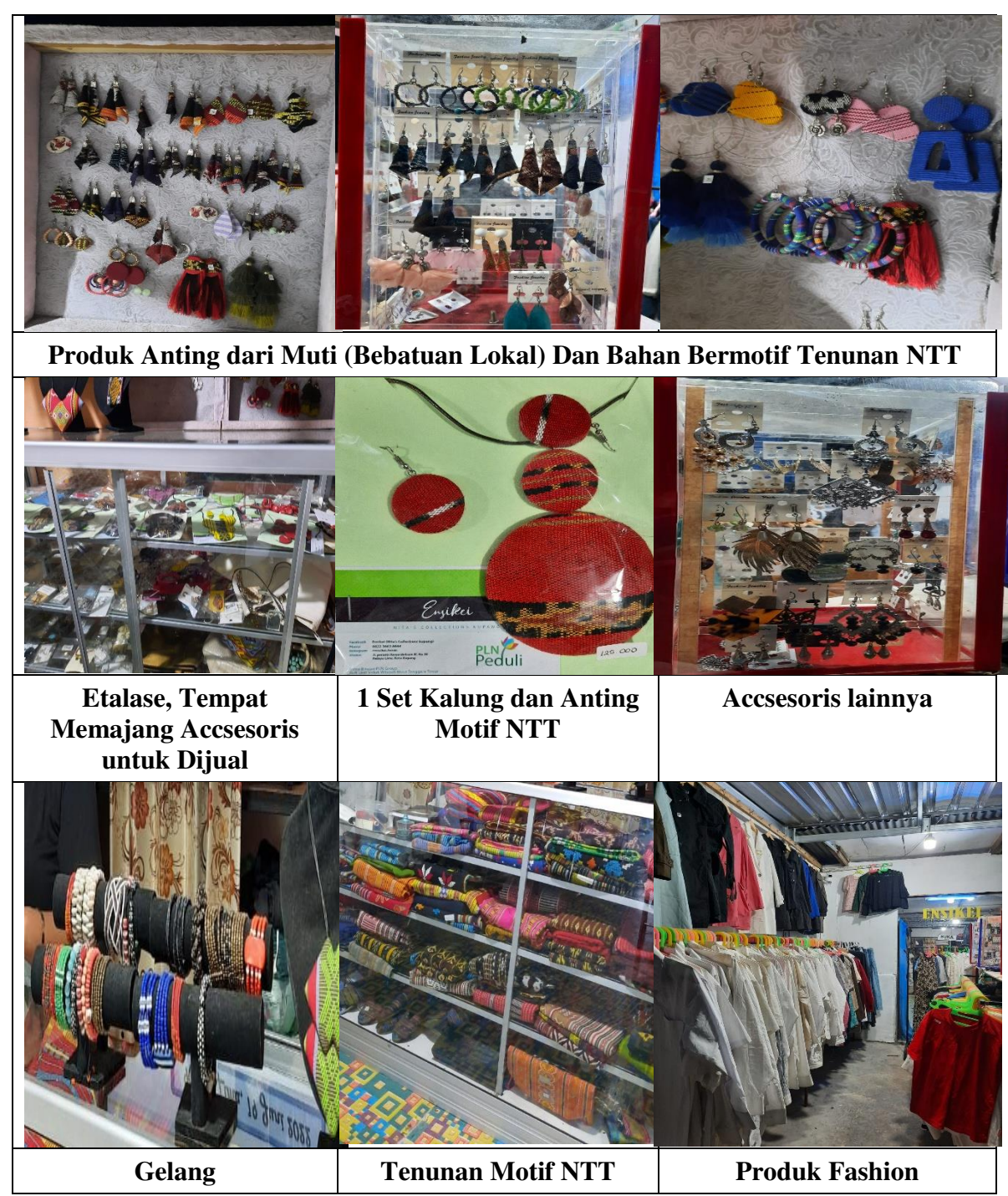
Gambar 1. Produk-produk yang dijual di UMKM Ensikei

Aplikasi media sosial tersedia mulai dari pesan instan hingga situs jejaring sosial yang menawarkan pengguna untuk berinteraksi, berhubungan, dan berkomunikasi satu sama lain. Aplikasi-aplikasi ini bermaksud untuk menginisiasi dan mengedarkan informasi online tentang pengalaman pengguna dalam mengonsumsi produk atau merek, dengan tujuan utama meraih ( engage ) masyarakat yang dalam konteks bisnis, people engagement dapat mengarah kepada penciptaan profit.