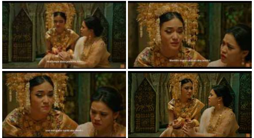
Gambar 4. Analisis 4

Meringgih agar dapat membebaskan ayahnya yang sedang ditahan di dalam penjara. Sehingga kondisi ini menunjukkan bahwa Nurbaya tidak memiliki kebebasan atas pilihan hidupnya sendiri.