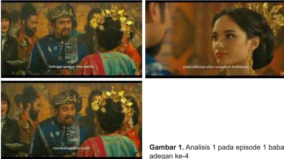
Gambar 1. Analisis 1 pada episode 1 babak pengenalan adegan ke-4

Dalam pengerjaan analisis akan berfokus kepada mise en scene yang terdapat dalam film seperti set latar, kostum dan tata rias, karakter dan pencahayaan. Pada bagian ini peneliti akan berfokus kepada analisis untuk mengungkapkan penerapan budaya Minangkabau pada Serial Musikal “Nurbaya”. Penggunaan mise en scene menjadi penentu dari aspek yang akan diteliti lebih lanjut menggunakan konsep semiotika Roland Barthes.