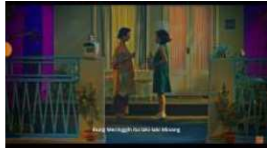
Gambar 3. Analisis 3