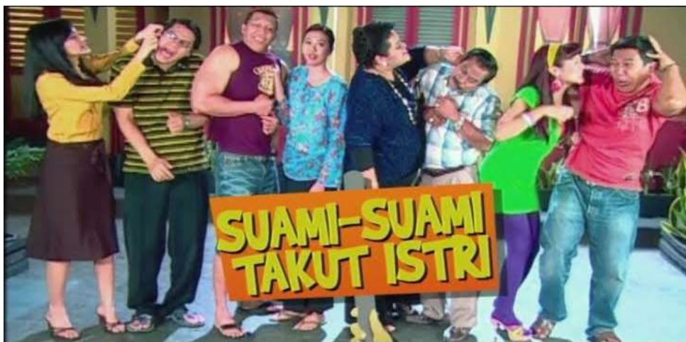
Gambar 2. Opening Suami Suami Takut Istri Versi 4