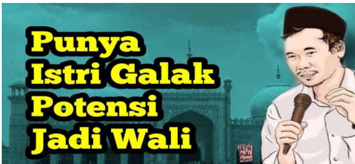
Gambar 5. Istri Galak Media Mengasah Kesabaran

Dalam sebuah pengajian Gus Baha (Risks.id 2020), menjelaskan jika seseorang mempunyai istri yang galak alias cerewet hendaklah bersabar. Sebab itulah fasilitas ujian yang Allah berikan untuk mengangkat derajat seorang hamba untuk menjadi kekasihNya (Wali). "Ada banyak jalur untuk menjadi wali, tetapi yang paling mudah ditemui dan tidak jauh dari kita adalah punya istri judes tapi kita sabar. Kalau jadi wali melalui jalur ilmu, jalur ibadah, jalur harta dan lainnya itu agak sulit dan tidak semua orang berkesempatan.