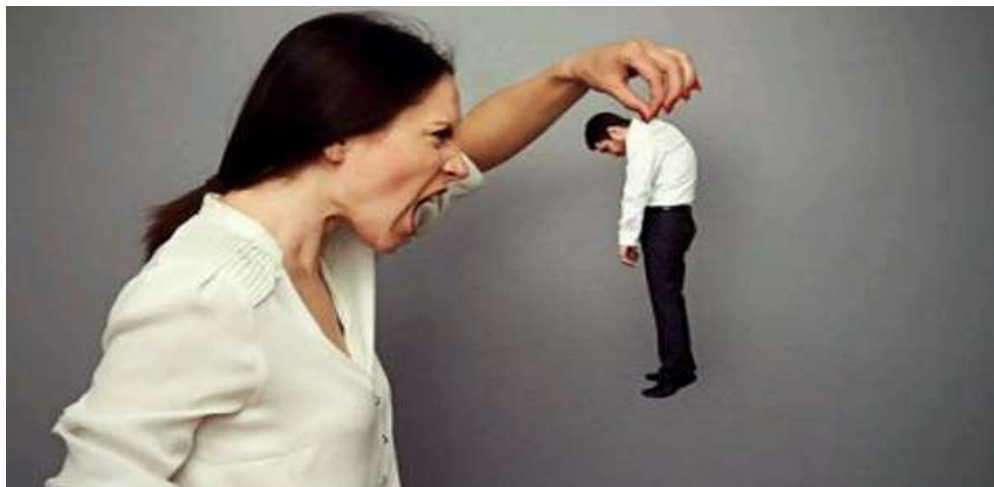
Gambar 1. Ilustrasi Istri Galak