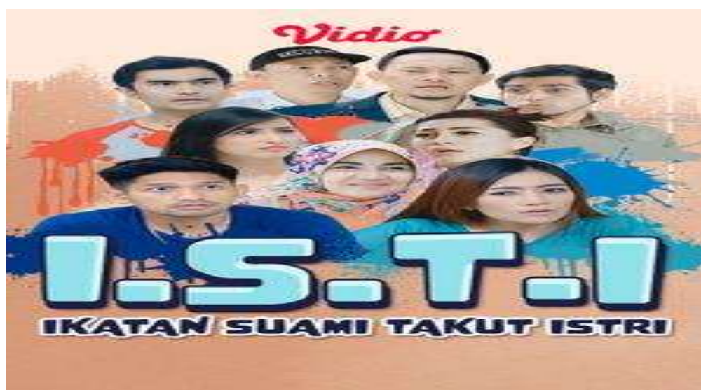
Gambar 3. ISTI (Ikatan Suami Takut Istri)

Setikom Suami-Suami Takut Istri kemudian muncul ke Layar Lebar dengan judul ISTI (Ikatan Suami Takut Istri). Jika selama ini masing-masing karakter hanya akan kita lihat terbatas di dalam studio, maka di versi layar lebar akan dibuat beda. ISTI adalah komedi situasi yang diproduksi Amanah Surga Productions ditayangkan di SCTV mulai Senin, 2 November 2015. Berdasar alasan di atas (alasan setiap istri) maka muncullah konflik baru dalam kehidupan rumah tangga masing-masing tokoh. Pada dasarnya para suami selalu 'kalah' namun apapun persoalan di antara mereka, mereka tetap punya solusi untuk kembali akur sebagai sebuah keluarga (P2K.stekom 2022).