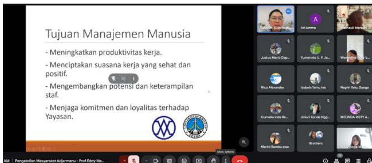
Gambar 1. Pembicara Menyampaikan Materi Pelatihan

Berdasarkan angket evaluasi yang dibagikan, seluruh peserta sepakat bahwa kegiatan pengabdian masyarakat berjalan dengan lancar, materi/layanan yang diberikan sesuai dengan kebutuhan mitra, pelaksana kegiatan melayani dengan sepenuh hati, dan pelaksana kegiatan segera merespon masalah yang terjadi ketika kegiatan sedang berlangsung.