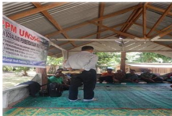
Gambar 1. Tim Pengabdian menyampaikan maksud dan tujuan kegiatan disertai diskusi