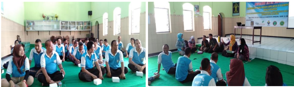
Gambar 1: Serap Aspirasi dengan warga binaan tentang kebutuhan ketrampilan