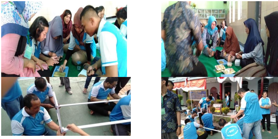
Gambar 3: Pemasangan Media Tanam