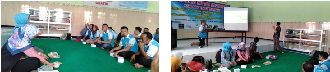
Gambar 5: Pengenalan Hidroponik