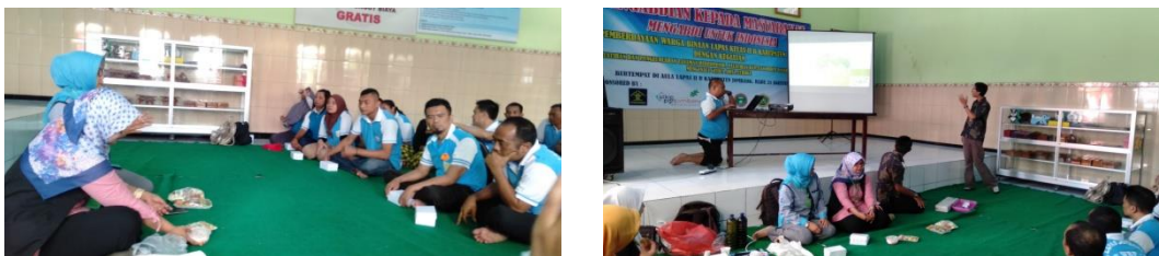
Gambar 2: Pengenalan Hidroponik