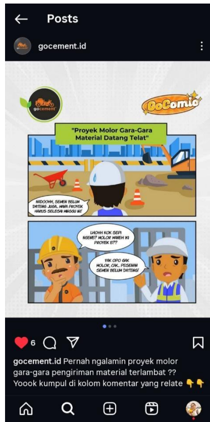
Gambar 13 komik strip pada Instagram