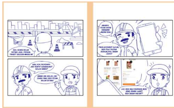
Gambar 10 Sketsa Komik Strip - Alternatif 1

Untuk menentukan gaya desain yang akan digunakan dalam produksi komik, penulis membuat dua alternatif sketsa dengan menggunakan naskah yang sama. Alternatif 1 menggunakan gaya gambar “chibi” dengan proporsi tubuh yang terlihat lebih kecil dan gemuk, sedangkan alternatif 2 menggunakan gaya gambar yang lebih realistis namun tetap bergaya kartun. Mentor penulis kemudian memutuskan gaya desain mana yang akan digunakan, dengan keputusan akhir adalah alternatif 1, dikarenakan alternatif 1 lebih mengikuti tema yang lebih ramah.