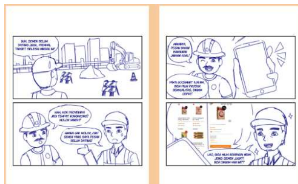
Gambar 11 Sketsa Komik Strip - Alternatif 2