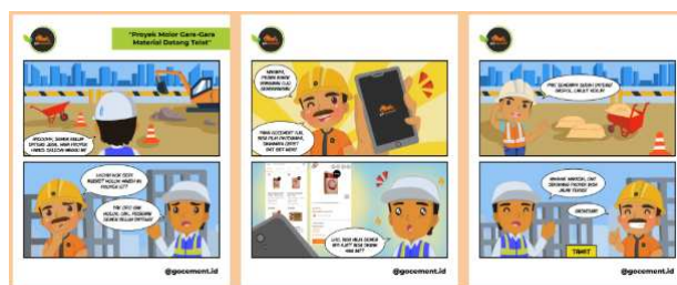
Gambar 12 Hasil akhir komik strip

menggambarkan situasi yang umum terjadi di lapangan, yaitu proyek konstruksi yang terhambat akibat keterlambatan pengiriman material. Cerita dimulai dengan Pak Budi, seorang kontraktor yang tampak frustrasi karena proyeknya terhenti lantaran semen belum kunjung datang, padahal tenggat waktu semakin dekat. Cak Cor kemudian hadir sebagai karakter solusi, menyindir kondisi proyek yang mandek dan memberikan saran untuk menggunakan GoCement sebagai platform pemesanan bahan bangunan yang cepat dan dapat diandalkan. Ia menunjukkan fitur GoCement melalui ponsel, yang memungkinkan pemilihan berbagai jenis semen dengan pengiriman cepat. Reaksi Pak Budi yang takjub dilanjutkan dengan adegan semen tiba di lokasi, para pekerja kembali aktif, dan proyek pun berjalan lancar. Cerita ditutup dengan suasana positif dan ajakan penuh semangat dari Cak Cor, memperkuat pesan bahwa solusi cerdas bisa mempercepat progres proyek.