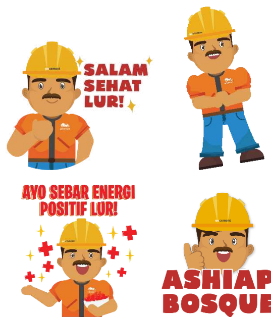
Gambar 8 Palet Warna Cak Cor

Palet warna pada komik strip menggunakan warna-warna terang dan netral untuk menyelaraskan dengan tema dan menyoroti identitas merek. Palet warna karakter Cak Cor telah disediakan oleh perusahaan dalam bentuk stiker PNG sebagai panduan untuk membantu penulis dalam menentukan warna-warna yang akan digunakan untuk latar, karakter, dan keseluruhan komik strip.