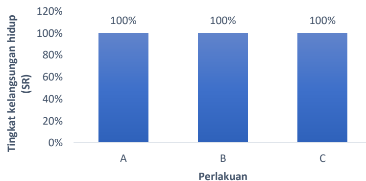
Gambar 3. Tingkat kelangsungan hidup (SR) kepiting bakau

kelangsungan hidup kepiting bakau ( Scylla serrata ) seperti disajikan pada Gambar 3 berikut: