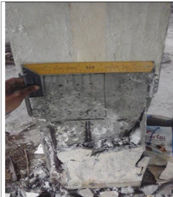
Gambar 2 : kondisi beton setelah pembobokan