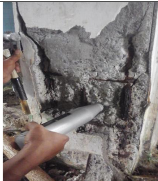
Gambar 3: Kondisi tulangan setelah pembobokan