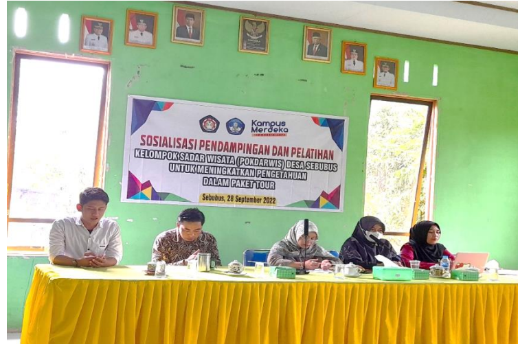
Gambar.3 Tim Pelaksana dan Kepala Desa Sebulus (Sesi Baca Doa)