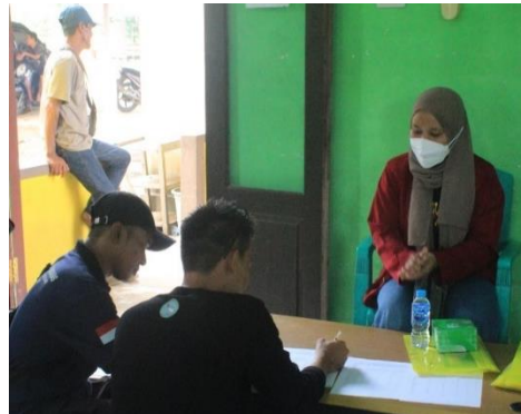
Gambar. 2 Registrasi Peserta