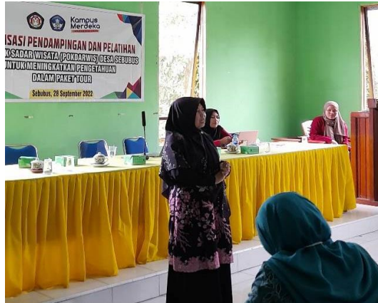
Gambar 4. Penyampaian Materi Oleh Ketua Tim Pelaksana