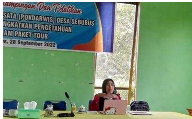
Gambar 5. Penyampaian Materi oleh Anggota Pelaksana 1

Berikut ini gambar pada saat anggota 1 TIM Pelaksana menyampaikan materi.