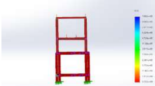
Gambar 7. Hasil Simulasi Factor of Safety 200 N

kg atau sebesar 200 N Regangan yang terjadi memiliki nilai maksimal sebesar 4,826 \times 10^{-6} N/mm 2 .