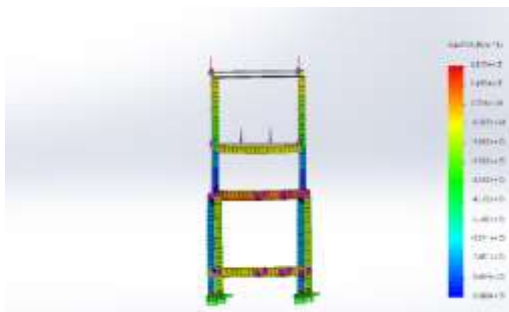
Gambar 4. Hasil Simulasi Von Misses Beban 200 N

Tegangan von misses adalah resultan dari semua tegangan yang terjadi dan diturunkan dari principal axes berhubungan dengan principal stress . warna yang terdapat pada gambar 4.9 diatas merupakan warna untuk perwakilan dari besar nilai von misses yang dapat dilihat sebelah medel rangka . pada gambaar diatas yang dapat kita lihat hasil dari simulasi pada rangka dengan solidworks untuk von misses strees maximum nilai nya