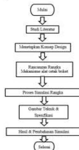
Gambar 1. Diagram Alir

Penelitian dan pembuatan eksperimen dilakukan di Laboratorium Teknik Mesin, Fakultas Teknologi Industri, Universitas Bung hatta.