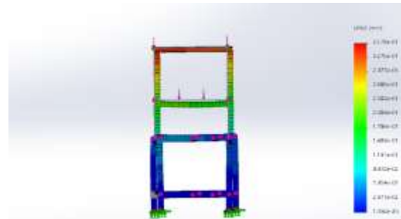
Gambar 5. Hasil Simulasi Displacement 200 N

Warna yang terlihat pada kerangka diatas adalah nilai perwakilan dari besar atau kecil nya displacement yang terjadi, displacement terbesar terjadi pada bagian kedudukan Hopper , pada kerangka terlihat bagian kedudukan bearing berwarna oren kecoklatan dan yang berwarna biru menandakan displacement terkecil terjadi.