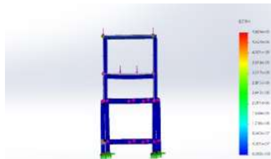
Gambar 6. Hasil Simulasi Strain 200 N

Pada hasil Strain memperlihatkan tampilan pada bagian yang diberikan beban static , beban yang diterima yaitu sebesar 20