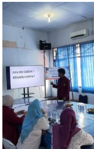
Gambar 2. Penyampaian Teori

Pada gambar 2 memperlihatkan bagaimana mahasiswa menjelaskan dan menyampaikan teori teori dasar dalam mendesain menggunakan Canva