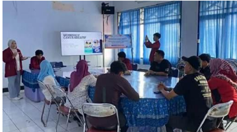
Gambar 1. Edukasi urgensi identitas visual

Pada gambar 1 menjelaskan bahwa identitas visual dapat meningkatkan penyebaran informasi pelayanan publik.