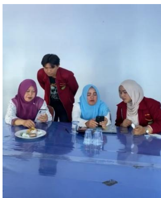
Gambar 4. Implementasi praktik

Pada gambar 4 memperlihatkan para pegawai mengoperasikan canva dengan didampingi oleh para mahasiswa untuk membantu kelancaran dalam pembuatan desain di canva