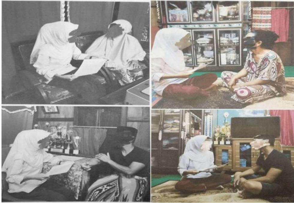
Gambar 1. Dokumentasi Kegiatan Pengabdian kepada Masyarakat

Dari wawancara singkat pasca kegiatan, diketahui bahwa sebagian besar peserta (sekitar 80%) merasa lebih siap menghadapi proses adaptasi ke depan. Mereka menyatakan bahwa edukasi mengenai tahapan emosional dan adanya simulasi coping mechanism membantu mereka untuk lebih memahami dan mengelola perubahan yang terjadi. Penemuan ini didukung oleh penelitian Laritmas & Ambarwati (2020) , yang menyebutkan bahwa intervensi edukatif yang dikombinasikan dengan pendekatan psikologis dapat mempercepat proses penyesuaian psikososial pada perempuan menopause.