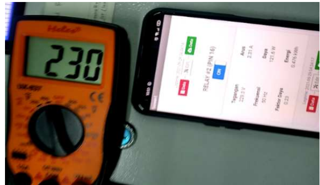
Gambar 4: Pengujian tegangan

Pengujian terhadap tegangan bertujuan untuk mengetahui kinerja dari sensor sudah bekerja dengan baik atau belum. Pzem-004t sendiri akan dipasang ke nodemcu esp8266 sebagai media dari pembacaan yang diatur dengan program. Sensor pzem-004t memiliki 4 terminal, 2 terhubung pada sumber tegangan, 2 terhubung pada current transformator dan 4 pin lainnya terhubung pada 5V dan ground, serta 2 pin digital input.