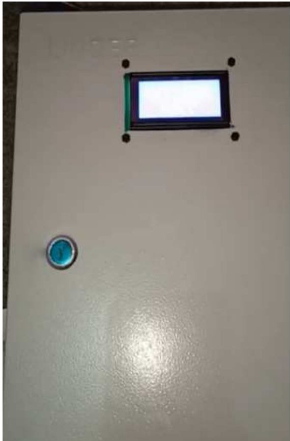
Gambar 2: Tampilan depan alat uji