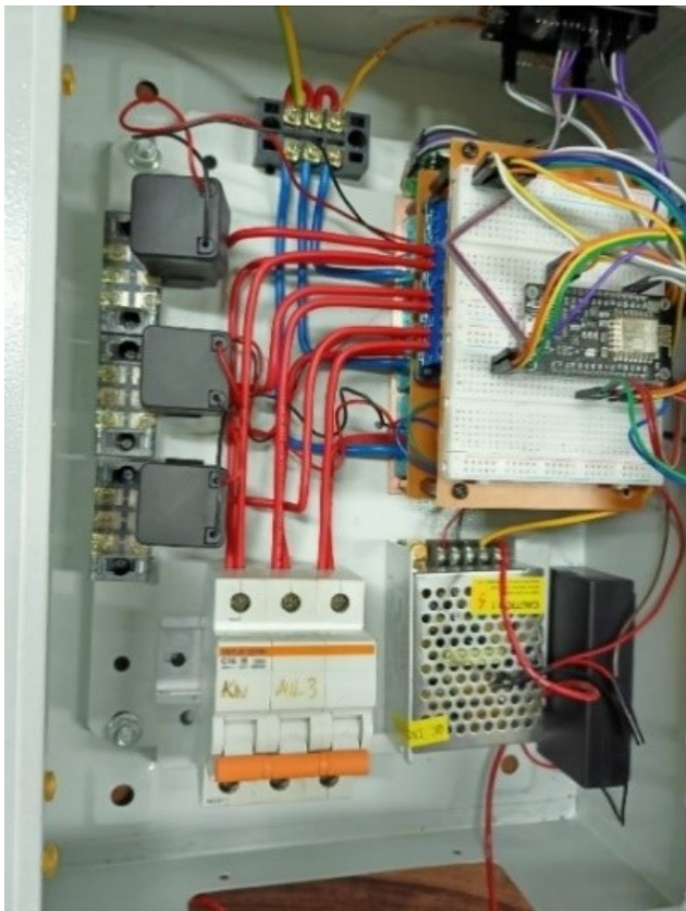
Gambar 3: Tampilan dalam alat uji

ratorium automasi Politeknik Negeri Ujung Pandang. Semua data yang didapatkan dengan cara memasang beban-beban ke alat monitoring dan akan dicatat hasil pembacaannya, data yang diolah menggunakan sensor pzem-004t dan alat ukur konvensional (voltmeter dan clamp meter). Alat ukur konvensional yang terpakai bukan merupakan standar pengukuran parameter kelistrikan dimana tingkat keakuratan tiap alat ukur berbeda-beda, namun dalam hal ini digunakan untuk mendapatkan nilai parameter kelistrikan sebagai sumber acuan yang dapat dibandingkan dengan alat monitoring ini. Pemilihan beban berdasarkan besar nilai daya beban yang dihubungkan ke salah satu fasa pada alat monitoring dan tiap fasa jika beban tersebut menggunakan sumber 3 fasa.