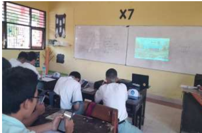
Gambar 1. Pembelajaran Berbantuan Kahoot!

Kendala kami dalam mengimplementasikan kurikulum merdeka khususnya pembelajaran berdiferensiasi salah satunya adalah belum mampu mengakomodasi minat siswa secara keseluruhan. Walaupun dalam mata pelajaran Pendidikan Agama Hindu siswanya tidak sebanyak mata pelajaran umum lainnya, tetapi kami guru belum bisa 100% memenuhi kebutuhan belajar siswa. Ada saja siswa yang tidak mampu mengikuti aktivitas pembelajaran secara maksimal.