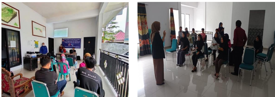
Gambar 4.1 Pemberian materi pelatihan

Pelaksanaan kegiatan pada tanggal 29 Juli 2023 dilaksanakan kegiatan pengabdian kepada masyarakat Kelurahan Bira. Adapun dokumentasi kegiatan sebagai berikut