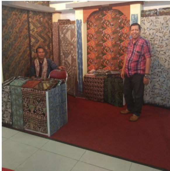
Gambar 5. Pameran Java Expo tanggal 27-30 Juni 2019 di Solo

Pada waktu pendampingan tentang promosi mitra sangat antusias menyimak penjelasan tim pelaksana. Tentunya mitra dapat memilih strategi promosi sesuai dengan kemampuan dan sumberdaya yang dimiliki mitra. Beberapa cara promosi yang dipilih mitra, salah satunya adalah public relation and publicity melalui pameran. Beberapa pameran yang diikuti oleh mitra antara lain Batik Bordir & Aksesoris Fair 2019 tanggal 10-14 April 2019 di Surabaya, Java Expo tanggal 27-30 Juni 2019 di Solo, Jambore Batik Jawa Timur tanggal 6 Juli 2019 di Banyuwangi dan Surabaya Great Expo tanggal 14-18 Agustus 2019 di Surabaya. Mitra dapat mempromosikan produk-produknya, meningkatkan brand image produk dan membangun networking dengan relasi.