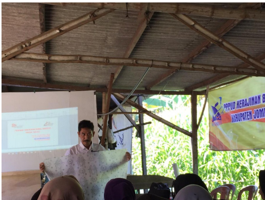
Gambar 2. Pelatihan Pengembangan Desain Motif Batik

Sebagai tindak lanjut dari kegiatan pelatihan pengembangan desain motif batik dilanjutkan dengan pendampingan dan monitoring. Kegiatan pendampingan dan monitoring bertujuan untuk menguatkan pengetahuan dan ketrampilan dari hasil penelitian sekaligus untuk memantau penerapan hasil pelatihan. Pelaksanaan pelatihan dan pendampingan pengembangan desain motif batik dapat berjalan dengan baik. Dengan kesungguhan mitra dan kerja keras tim pelaksana, kegiatan pelatihan dan pendampingan pengembangan desain motif batik membuahkan hasil yaitu munculnya 2 (dua) buah desain motif batik yang benar-benar berbasis kearifan lokal Jombang. Kedua desain motif batik tersebut adalah motif Jombang Beragam dan Kopi Excelsa.