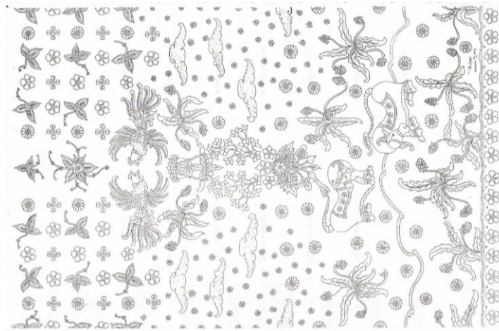
Gambar 3. Desain Motif Jombang Beragam

Desain motif Jombang Beragam menggambarkan cerita rakyat pada wilayah Jombang yaitu Kebo Kicak dan Surotanu, tumbuhan Jombang, Sungai Brantas, tumbuhan kopi, ringin contong, ayam bekisar dan bunga sedap malam, serta unsur alam awan dan mendung. Adapun deskripsi motif Jombang Beragam sebagai berikut: