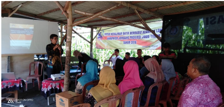
Gambar 1. Pelatihan Penerapan QFD dalam Pengembangan Desain Motif Batik