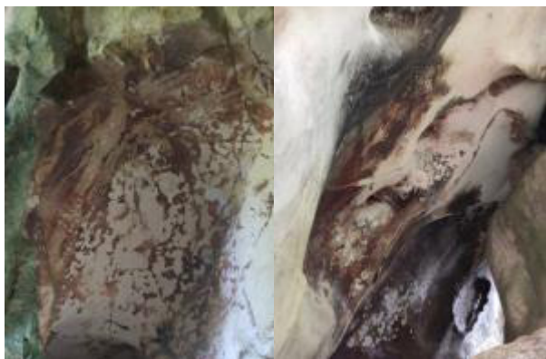
Gambar 1. Lukisan-lukisan tangan manusia pada dinding gua di leang-leang Maros.