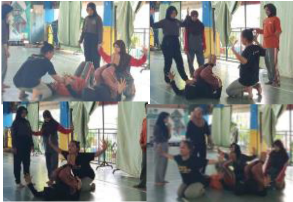
Gambar 5. Mentransmisikan konsep dan ide koreografi kepada penari yang telah melalui tahap diskusi, kurasi, dan evaluasi dalam proses kreatif reka cipta tari Toaleang Marusu.