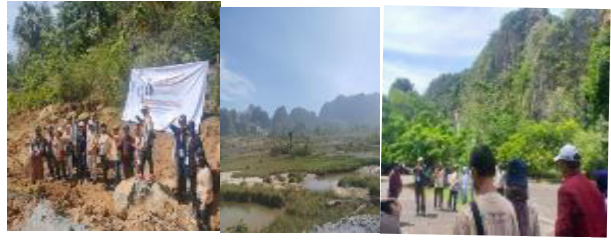
Gambar 3. Proses observasi pada lokasi leang-leang Maros yang dilakukan dalam mengumpulkan data-data sebagai bahan inspirasi pada reka cipta koreografi tari Toaleang Marusu.