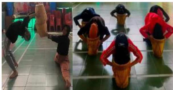
Gambar 14. Menginkorporasikan koreografi dan artistik, setting/properti dalam reka cipta tari Toaleang Marusu.