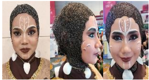
Gambar 11. Makeup yang terinspirasi dari hewan endemik Sulawesi seperti Anoa dan Babi Rusa yang ditransformasikan pada riasan penari dalam proses kreatif reka cipta tari Toaleang Marusu.

Interpretasi visual dari busana tarian ini merujuk pada penggunaan warna cokelat tanah, manifestasinya adalah untuk menciptakan atmosfer purba dan penggambaran latar dari lingkungan gua. Kemudian penggunaan urat-urat akar yang menjuntai merepresentasikan jalinan kehidupan masa lalu dan menghadirkan simbol-simbol koneksi dari alam yang ada di leang-leang Maros. Hadirnya ornamen-ornamen moluska sebagai aksesoris, bentuk manifestasi dari hasil koneksi dari daerah pesisir ataupun wilayah perairan, di mana simbol ini merupakan bukti arkeologis yang