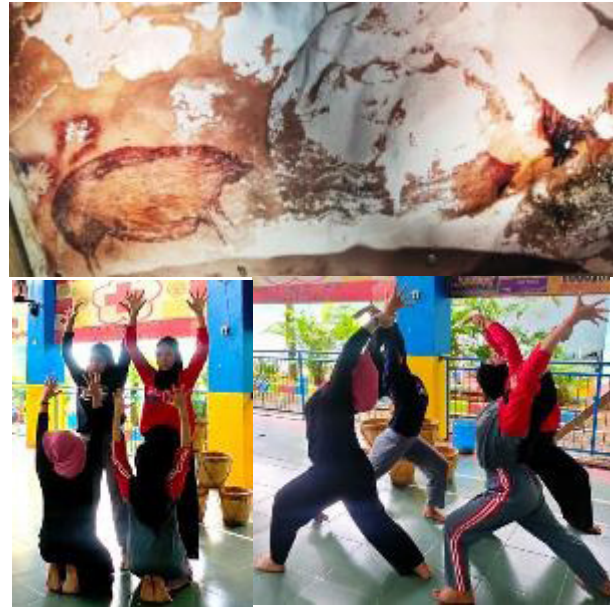
Gambar 7. Hasil eksplorasi dan improvisasi dalam menemukan simbol-simbol gerak yang diadaptasi dari lukisan tangan pada dinding gua di leang-leang Maros lalu ditransmisikan kepada penari dalam proses kreatif reka cipta tari Toaleang Marusu.

Trik-trik yang dilakukan oleh pereka cipta dalam proses kreatif sejatinya melintasi pengalaman yang telah melebur dalam