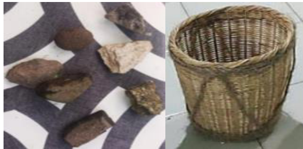
Gambar 13. Artistik/properti yang digunakan dalam proses kreatif reka cipta tari Toaleang Marusu.