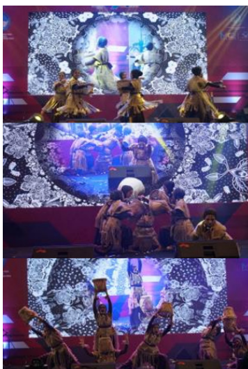
Gambar 18. Segmentasi adegan penari sedang mengejawantahkan aktivitas masyarakat Toalean dalam reka cipta tari Toaleang Marusu, simbol-simbol dalam pengkomposisian koreografi tari ini terinspirasi dari praksis berburu dan mengumpulkan kerang/mollusca.

telah dientitaskan oleh pereka cipta dalam praksis kreatifnya. Perwujudan artistik dari jejak kebudayaan prasejarah Toalean yang ditemukan di situs-situs purbakala Maros, Sulawesi Selatan tersebut mempresentasikan temuan-temuan arkeologis dan artefak yang digunakan sebagai bahan perenungan utama dalam merancang setiap gerakannya. Manifestasi dari tumpuan dan basis perekaciptaan tari tersebut dalam reka cipta koreografi Tari Toaleang Marusu menjadi temuan ( problem solver ).