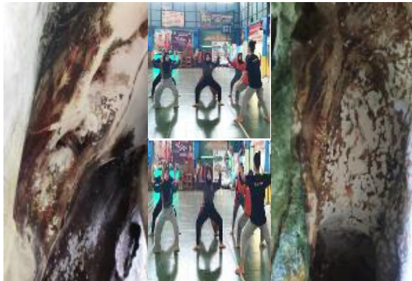
Gambar 6. Lukisan tangan pada dinding gua di leang-leang Maros yang menjadi inspirasi gerak kemudian diadaptasi lalu ditransmisikan kepada penari dalam proses kreatif reka cipta tari Toaleang Marusu.

menghadirkan lukisan Babi Rusa. Dengan adanya data-data tersebut nalar kreatif koreografer bekerja untuk menghadirkan bahasa baru melalui idiom tari yang dishahihkan pada repertoar Tari Toaleang Marusu .