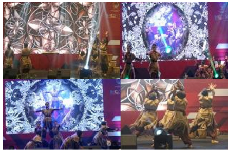
Gambar 16. Segmentasi adegan penari dengan simbol-simbol tangan yang terinspirasi dari lukisan cap tangan pada leang-leang Maros dalam reka cipta tari Toaleang Marusu. (Sumber: Ilham, 2025)