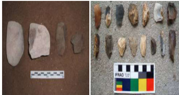
Gambar 12. Temuan artefak pada leang-leang Maros berupa alat serpih batu yang menjadi bahan inspirasi artistik/properti dalam proses kreatif reka cipta tari Toaleang Marusu.

Rustiyanti (2020, hlm. 453-564) menyatakan bahwa atmosfer dalam pertunjukan tari baik itu pereka ciptaannya berbasis tradisi, nontradisi, ataupun dalam konteks tari kontemporer, seyogyanya dapat dimanifestasikan secara mendalam sehingga dapat tercipta dinamika yang ekspresif. Pengolahan koreografi tari yang telah dilakukan dengan menginkorporasikan segala anasir-anasir tari seperti vokabuler gerak, musik iringan, artistik/properti, makeup , busana, dan pendukung lainnya dapat mengejawantahkan reka cipta Tari Toaleang Marusu dan selanjutnya disajikan kepada apresiator. Setelah usai pertunjukan pun selanjutnya dapat dilakukan evaluasi untuk mendiskusikan keberlanjutan reka cipta tari tersebut.