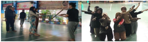
Gambar 15. Menginkorporasikan koreografi dan properti batu dalam reka cipta tari Toaleang Marusu.