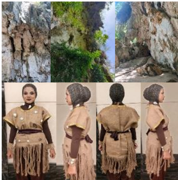
Gambar 10. Wujud busana yang diadaptasi dari segi warna, urat-urat akar, dan mollusca sebagai unsur-unsur dari bentang alam leang-leang Maros dalam proses kreatif reka cipta tari Toaleang Marusu.

(Fitriani, 2022, hlm. 85-96; Kiswanto, 2024, hlm. 315-330; Ketut, 2024, hlm. 265-272).