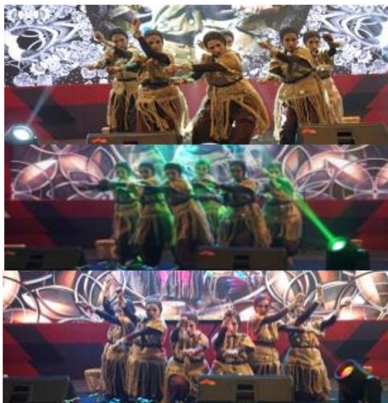
Gambar 17. Segmentasi adegan penari sedang memainkan batu, adegan ini terinspirasi dari temuan artefak batu lancip point di leang-leang Maros dalam reka cipta tari Toaleang Marusu.