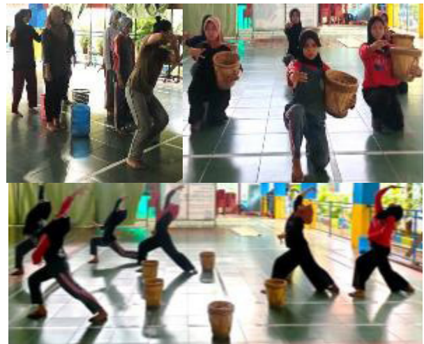
Gambar 8. Pengembangan vokabuler gerak yang didasari pada penjajakan ontologis lalu ditransmisikan kepada penari dalam proses kreatif reka cipta tari Toaleang Marusu.

Pengejawantahan konsep-konsep gagasan yang dilalui dengan proses penjajakan (Haruna, 2024, hlm. 532-550) telah disesuaikan dengan tema yaitu tentang tinggalan kultur prasejarah manusia Toalean Maros di Sulawesi Selatan, hal tersebut seyogyanya telah melalui proses diskusi dan pemahaman antara penari dan koreografer. Unsur-unsur itu telah diejawantahkan kemudian ditransmisikan ke dalam konteks ide garapan, bentuk-bentuk movement , eksplorasi, cita rasa, dan visual dalam perekaciptaan koreografi tari Toaleang Marusu . Proses transformasi ini mengacu pada sumber yang terkandung dalam tinggalan kultur masyarakat Toalean, simbol-simbol yang dihadirkan pada lukisan di dinding gua menyiratkan kehadiran dan proses kehidupan, realitas/ontologis merupakan