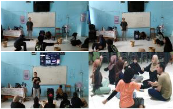
Gambar 9. Koreografer dan penari menelisik dan melakukan evaluasi iringan tari secara signifikan dalam proses kreatif reka cipta tari Toaleang Marusu.