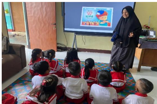
Gambar 2. Kegiatan Belajar Mengajar dengan Metode Bercerita Dua Arah pada Siklus 1

interaksi pendidikan anak usia dini. Setelah diterapkan teknik bercerita dua arah pada siklus I, kemampuan menyimak anak mengalami peningkatan. Peningkatan ini tidak hanya disebabkan oleh penggunaan cerita sebagai media pembelajaran, tetapi juga karena adanya keterlibatan aktif anak selama proses bercerita. Melalui pertanyaan interaktif, diskusi sederhana, dan kesempatan untuk memberikan tanggapan, anak terdorong untuk memusatkan perhatian pada informasi yang disampaikan guru. Keterlibatan tersebut memungkinkan anak memproses informasi secara lebih mendalam sehingga pemahaman terhadap isi cerita menjadi lebih baik. Hal ini sejalan pendapat Nurhayati (2025) yang menjelaskan bahwa prinsip utama bercerita dua arah adalah interaktivitas, yaitu memberikan kesempatan kepada anak untuk merespons, bertanya, dan menyampaikan ide selama kegiatan berlangsung.