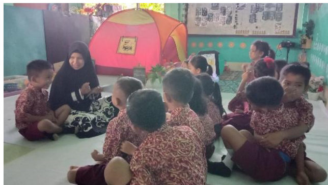
Gambar 3. Kegiatan Belajar Mengajar dengan Metode Bercerita Dua Arah pada Siklus 2

pertanyaan interaktif dan berani mengemukakan pendapatnya. Isnaini dkk. (2025) menjelaskan bahwa memberikan pujian dan penguatan positif sangat penting dalam proses komunikasi dua arah. Ketika anak berhasil berkomunikasi dengan baik atau menunjukkan perkembangan dalam keterampilan sosial dan kognitif, pujian yang tulus dari orang tua atau pendidik akan meningkatkan kepercayaan diri mereka. Penguatan positif ini mendorong anak untuk terus berinteraksi dan berpartisipasi dalam percakapan, mempercepat perkembangan kemampuan berbahasa, sosial, dan kognitif mereka.