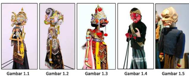
Gambar 1. Jenis-jenis wayang berdasarkan karakternya