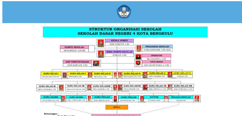
Gambar 3. Halaman Struktur Organisasi

Halaman Struktur Organisasi merupakan halaman dimana pengunjung dapat melihat struktur organisasi SDN 4 Kota Bengkulu dimulai dari kepala sekolah hingga guru SDN 4 Kota Bengkulu.