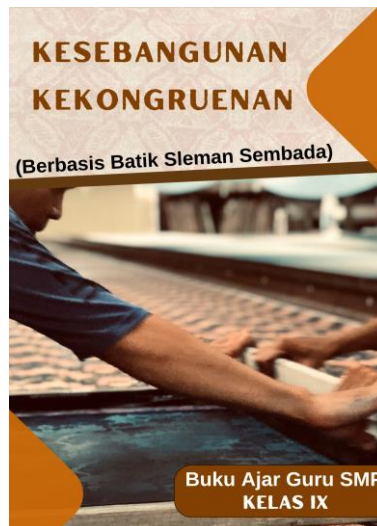
(Gambar 3. Sampul bahan ajar guru)

didik SMP kelas IX pada kelompok belajar di Moyudan, Sleman. Dengan menggunakan model pembelajaran Problem Based Learning (PBL) , peserta didik akan diajak untuk berdiskusi dalam kelompok, lalu melakukan presentasi atas hasil pengerjaan yang dilakukan dalam kelompok, dan melakukan tanya jawab. Guru menyiapkan bahan ajar seperti pada gambar 3 , agar kegiatan pembelajaran dapat berjalan dengan lebih terstruktur. Guru juga menyiapkan PPT yang berisi materi ajar sehingga mempermudah menjelaskan materi kesebangunan dan kekongruenan. Guru juga membawa Batik Sleman Sembada sebagai representasi bentuk nyata dalam mempelajari kesebangunan dan kekongruenan serta menyiapkan LKPD, lembar asesmen, dan angket.