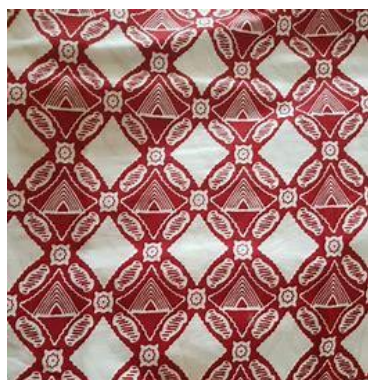
Gambar 1. Batik Sleman Sembada Berwarna Merah

Etnomatematika merupakan salah satu pendekatan dalam pembelajaran yang mengintegrasikan budaya ke dalam pembelajaran matematika. Menurut Peni dan Baba dalam Nasution dan Suparni (2024) etnomatematika merupakan pendekatan pembelajaran yang dapat membantu peserta didik untuk mengeksplorasi budaya mereka sehingga memperoleh ide dari konsep-konsep matematika. Salah satu budaya yang dapat digunakan dalam pembelajaran adalah Batik Sleman Sembada. Batik Sleman Sembada merupakan salah satu jenis batik di Sleman yang tidak semua orang dapat mengenakannya. Batik Sleman Sembada memiliki dua jenis warna, yaitu merah dan hitam, seperti yang ditunjukkan pada gambar 1 dan gambar 2. Batik yang berwarna merah hanya dapat digunakan oleh peserta didik pada jenjang Sekolah Dasar negeri di Sleman. Kemudian, batik yang berwarna hitam hanya dapat digunakan oleh pegawai-pegawai yang berkaitan dengan pemerintah kabupaten Sleman, seperti Pegawai Kabupaten, Pegawai Kecamatan, dan Guru yang berada di Sleman.