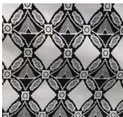
Gambar 2. Batik Sleman Sembada Berwarna Hitam

Batik berkembang seiring dengan berjalannya waktu dan melekat sebagai budaya masyarakat Indonesia (Hakim et al., 2023). Pada tahun 2003 UNESCO mengakui bahwa batik termasuk ke dalam satu warisan dunia dalam kategori budaya tak benda. Batik Sleman Sembada merupakan salah satu batik yang sudah terkenal di kalangan masyarakat Kabupaten Sleman. Peserta didik sekolah negeri di Sleman menggunakan Batik Sleman Sembada sebagai seragam pada hari