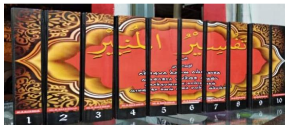
Gambar 1 Cover Tafsir Al-Munir Versi Cetakan Baru Lontarak Bugis

Mengenal karya tafsir ulama Nusantara yang telah mampu menafsirkan Juz 30 lengkap patut dihargai dan disyukuri misalnya dalam khazanah tafsir nusantara, banyak karya ulama yang sangat memberikan sumbangsih luar biasa dalam penafsiran Al-Qur'an. Karya-karya monumental seperti Abdul Rauf al-Sinkili dengan karya Tajumanul Qur'an , Hamka dengan kitab Tafsir al-Azhar , dan Quraish Shihab dengan kitab Tafsir al-Misbah . Merambah ke kajian tafsir di Indonesia ternyata memiliki keunikan dan kekhasan tersendiri bagi Indonesia untuk mengenal tafsir lokal Nusantara, misalnya di Sulawesi Selatan, terdapat banyak karya ulama Bugis yang memiliki kekhasan dan juga menjunjung tinggi nilai budaya yang ada. Kekhasan yang digunakan oleh ulama Bugis tersebut menjadi corak serta gaya bahasa dalam transformasi lokal yang cukup berkontribusi dalam membangun insan yang berkarakter atau melihat hal-hal yang terjadi di tengah-tengah masyarakat sendiri khususnya masyarakat Wajo. Tafsir lokal yang dimaksudkan adalah tafsir Al-Munir . Tafsir ini adalah tafsir 30 Juz yang ditulis dengan bahasa Bugis Lontarak. AGH. Daud Ismail juga memiliki karya tentang biografi singkat gurunya, AGH. Muhammad As'ad al-Bugisy dengan tiga bahasa, bahasa Bugis Lontarak, bahasa Indonesia dan bahasa Arab.