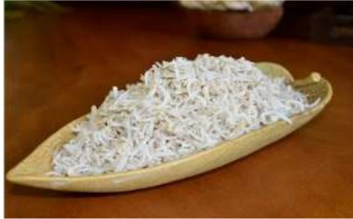
Gambar 1. Ikan Teri Nasi Segar

Pengadaan bahan baku teri segar diperoleh dari hasil tangkapan nelayan setempat yang biasanya mudah di dapatkan di tempat PPI Jangkar, Kabupaten Situbondo. Ikan teri segar yang baru diperoleh dari nelayan segera ditimbang untuk mengetahui berat awal bahan baku, kemudian dicuci bersih dengan air mengalir untuk disiapkan ke proses selanjutnya. Untuk mengetahui komposisi kimia awal ikan teri segar dilakukan analisa proksimat terhadap kandungan gizi ikan teri segar. Pada uji proksimat yang dijadikan tolak ukur uji adalah kadar protein, karbohidrat, lemak, kalsium, dan vitamin. Berikut tabel komposisi kimia ikan teri segar disajikan pada tabel dibawah ini: