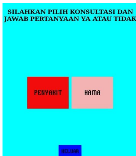
Gambar 5. Tampilan Menu Konsultasi

Pada tampilan menu konsultasi adalah bagian tampilan dimana pengguna akan di tujukan untuk memilih salah satu konsultasi yang ingin digunakan kemudian setelah itu aplikasi akan menampilkan hasil konsultasi yang telah di pilih pengguna.