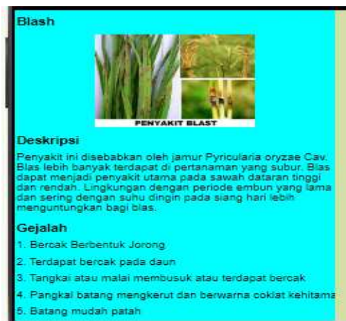
Gambar 6. Tampilan Data Hasil Penelusuran

Tampilan data menu penyakit merupakan data hasil peneusuran pengguna yang akan memunculkan nama penyakit atau hama tergantung pilihan pengguna, deskripsi, gejala hingga pengendaliannya.