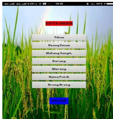
Gambar 4. Tampilan Menu Data Hama

Tampilan menu data hama merupakan penelusuran atau hasil pencarian sehingga dapat menampilkan jenis hama penyakit tanaman padi sehingga pengguna dapat mengetahui jenis hama yang menyerang tanaman padi mereka.