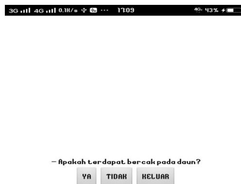
Gambar 7. Tampilan Peertanyaan Konsultasi

Dalam tampilan ini menampilkan pertanyaan yang sesuai dengan konsultasi yang kita pilih