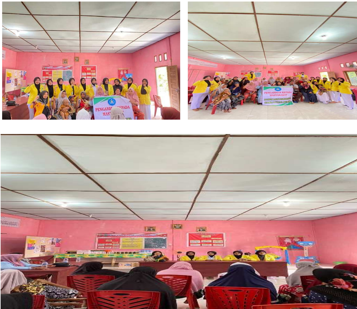
Gambar 1.1 Foto Kegiatan Bersama Peserta Pengabdian Masyarakat