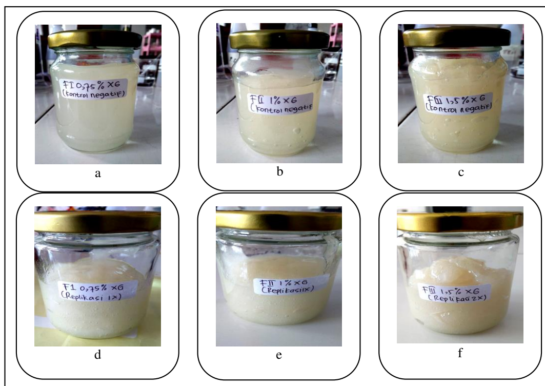
Gambar 3. Hasil uji organoleptis gel kompleks molekular AG-KS (a) kontrol negatif F1, (b) kontrol negatif F2, (c) kontrol negatif F3, (d) Formula 1, (e) Formula 2, (f) Formula 3.

berinteraksi secara fisik dengan saling mempengaruhi ikatan sambung-silang dalam strukturnya yang mengakibatkan perubahan fisik, struktural, termal, dan mekanik (De Morais Lima et al., 2017). Tekstur sediaan dari F1, F2, F3 dan kontrol negatif semuanya memiliki konsistensi semipadat dan kenyal.