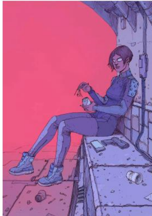
Fig 1. Contoh gambar dengan teknik pewarnaan blok

lebih dramatis, misalnya. Penyajian pada warna yang lebih dramatis dapat dimanfaatkan dengan teknik pewarnaan blok tanpa menerapkan gradasi.