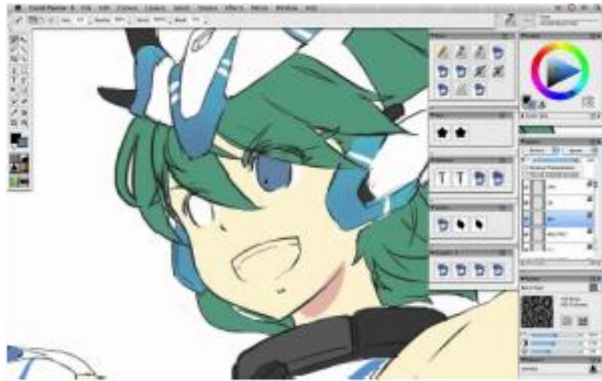
Fig 2. Contoh menggambar, mewarnai dan layout secara digital