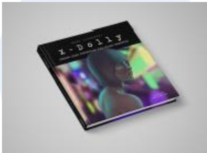
Fig 3. Desain cover buku ilustrasi

Desain halaman sampul menyajikan gambar ilustrasi tampilan tokoh yang sedang diangkat. Gemerlap malam lampu cafe dan diskotik khas di tengah keramaian lokalisasi “Dolly” tampak seorang perempuan tengah berdiri terdiam dengan pandangan kosong. Ilustrasi tersebut menyimbolkan bahwa si tokoh sebagai seorang pekerja seks sedang menoleh ke arah hiruk pikuk keramaian malam. Terlihat pula ada sedikit cahaya di matanya sebagai simbol harapannya bahwa ada jalan yang lebih baik dari yang dijalaninya saat ini.