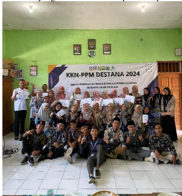
Gambar 2. Pelatihan pembuatan dan pengoperasian media Wordwall

Dalam hal itu, tim KKN 01 berinisiatif untuk mengadakan kegiatan pelatihan pembuatan game edukasi Wordwall yang diikuti para guru Asemgede Ngusikan. Dalam kegiatan pelatihan tersebut, seluruh peserta memiliki antusias yang cukup tinggi karena dalam kegiatan ini dikemas secara menarik dan informal. Narasumber memberikan teori dan arahan dalam membuat dan mengaplikasikan media Wordwall , sedangkan peserta mengikuti arahan yang diberikan narasumber secara bertahap. Hasil dari pelatihan ini cukup memuaskan. Peserta dapat membuat evaluasi pembelajaran berbasis game edukasi Wordwall secara langsung dan sesuai dengan kreatifitas masing-masing peserta, sehingga diperoleh berbagai macam template dan model yang menarik dari hasil pelatihan peserta.