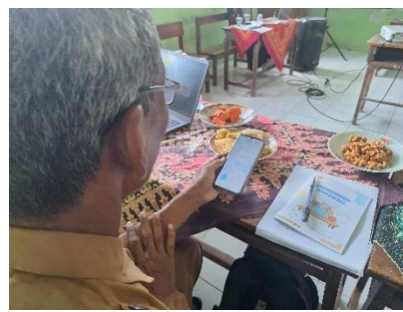
Gambar 1. Kegiatan Diklat pembuatan media evaluasi pembelajaran berbasis game edukasi Wordwall

Setelah dilakukannya implementasi media Wordwall kepada para pendidik Asemgede Ngusikan, didapatkan hasil bahwa adanya inovasi baru bagi para pendidik Desa Asemgede dalam mengevaluasi pembelajaran peserta didik. Hal itu sesuai apa yang Tim KKN harapkan, yaitu dengan membuat dan menggunakan media pembelajaran Wordwall diharapkan mampu memberi inovasi serta peningkatan kreatifitas para pendidik Asemgede dalam mengevaluasi pembelajaran peserta didik.