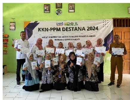
Gambar 6. Kelompok peserta diklat dan anggota KKN 01 bidang Pendidikan

Hal ini dapat dilihat dari respon peserta selama proses pelatihan serta hasil angket yang diberikan kepada 15 peserta pelatihan di Desa Asemgede Ngusikan. Berikut diuraikan hasil angket 15 peserta pelatihan di Desa Asemgede Ngusikan pada tabel dan diagram dibawah ini: