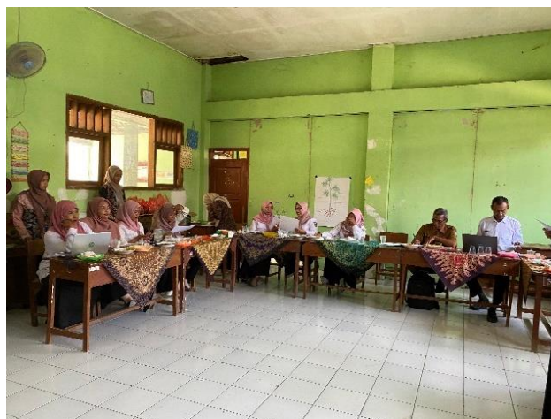
Gambar 3. Proses pembuatan Wordwall peserta pelatihan