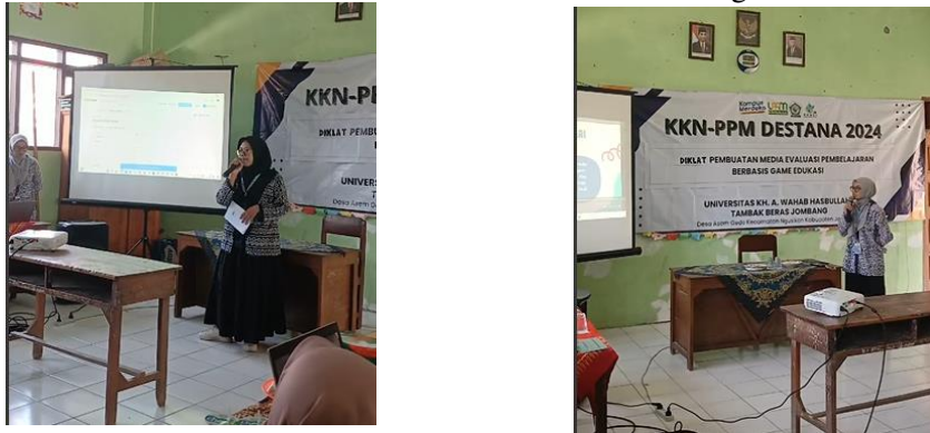
Gambar 4. Kegiatan Pelatihan pengoperasian Wordwall

Berdasarkan hasil pada diklat pembuatan dan pengoperasian game online untuk evaluasi pembelajaran yang dilakukan pada tanggal 26 September 2024 bertempat di SDN Asemgede Ngusikan, dapat disimpulkan bahwa peserta diklat pembuatan evaluasi pembelajaran berbasis game edukasi dengan website Wordwall yang diikuti seluruh guru dari tingkat KB, TK dan SDN Asemgede Ngusikan sangat antusias dan aktif mengikuti pelatihan pembuatan evaluasi pembelajaran berbasis gameonline dengan menggunakan website Wordwall . Berikut adalah sebagian dokumentasi kegiatan kegiatan yang di narasumberi oleh salah satu mahasiswa Tim KKN di Desa Asemgede.