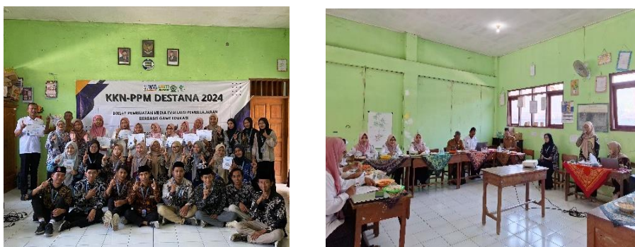
Gambar 5. Dokumentasi seluruh peserta pelatihan dan Tim KKN 01