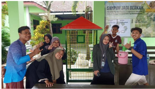
Gambar 1. Sebelum dimulainya acara sosialisasi Bak Sampah