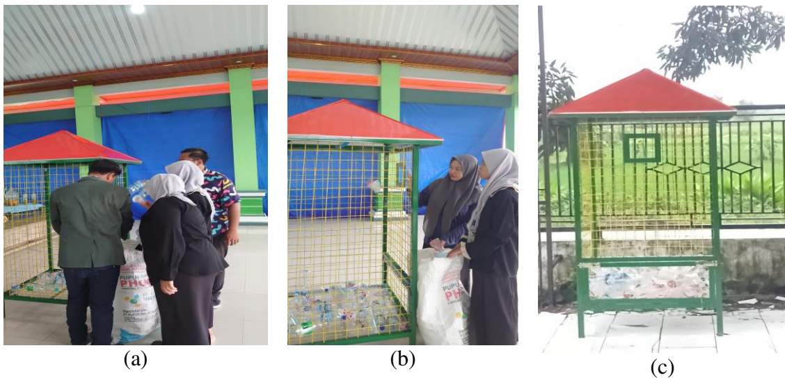
Gambar 2. (a) Pemilahan sampah botol plastik (b) Awal percobaan pembuangan botol plastik di Bak Sampah (c) Hasil dari pemilahan sampah plastik di Bak Sampah