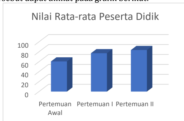
Gambar 3. Grafik Nilai Rata-Rata Peserta Didik

Pertemuan II mulai dilakukan sejak perencanaan pembelajaran disusun dengan mempertimbangkan poin-poin refleksi pada pelaksanaan pertemuan I. Pada Pertemuan ini, peneliti mampu membawakan proses pembelajaran dengan lebih baik dan kelas menjadi lebih kondusif. Peserta didik mulai menyimak pembelajaran yang dibawakan oleh peneliti. Penerapan media komik digital menggunakan aplikasi canva pun terlaksana dengan baik dan hasil belajar berdasarkan penilaian di pertemuan II ini menunjukkan peningkatan. Nilai rata-rata kelas yang diperoleh sebesar 83,5 dengan ketuntasan klasikal 100%, yang mana sudah mencapai batas minimal ketuntasan di SD Negeri Bantengputih. Peningkatan tersebut dapat dilihat pada grafik berikut: