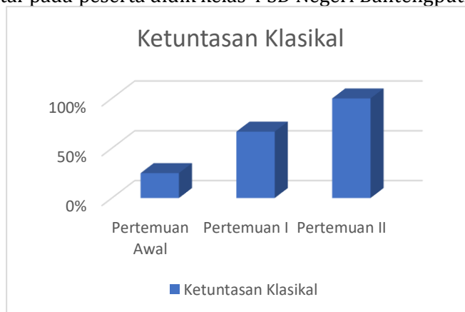
Gambar 4 Grafik Ketuntasan Klasikal

Grafik di atas menyajikan peningkatan nilai rata-rata kelas setelah diterapkannya media komik digital pada peserta didik kelas 4 SD Negeri Bantengputih