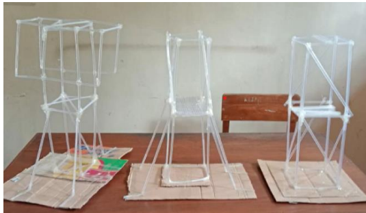
Gambar 3. Hasil Proyek STEM Maket Menara Tahan Gempa Berbahan Sedotan Plastik.

Jika maket menara tersebut meleyot dan beban terpentil, maka produk maket menara dinyatakan gagal. Setelah melakukan uji produk, setiap kelompok berdiskusi menjawab beberapa pertanyaan yang berhubungan dengan proyek STEM maket menara yang telah dilakukan baik berhubungan dengan produk maupun proses.