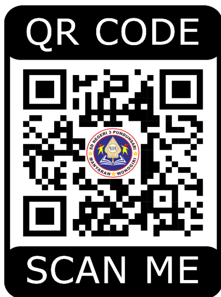
Gambar 6. QR Code Video Inovasi, Aksi, dan Persepsi Pembelajaran SIAP STEM di SD Negeri 3 Pundusari.

Sebagai tindak lanjut untuk memperbaiki hasil tes peserta didik yang belum mencapai nilai maksimal, guru menampilkan jawaban tes yang benar. Jawaban tes berupa istilah-istilah kebencanaan ditampilkan di depan kelas dengan ditunjukkan pula arti istilah tersebut sesuai Kamus Besar Bahasa Indonesia (KBBI) versi daring. Peserta didik diingatkan untuk mengamati penulisan kata yang benar dan ketelitian dalam menuliskan jawaban.