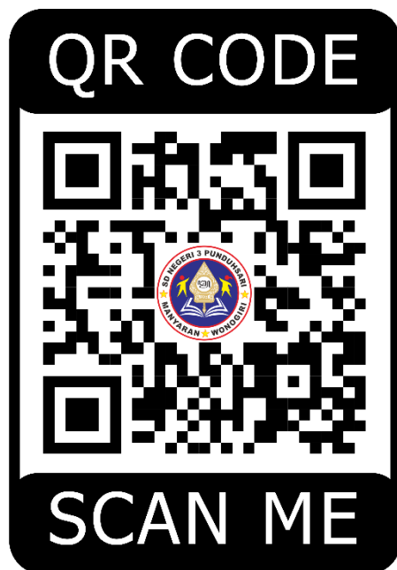
Gambar 1. QR Code Video Simulasi Bencana Gempa Bumi di SD Negeri 3 Pundusari.