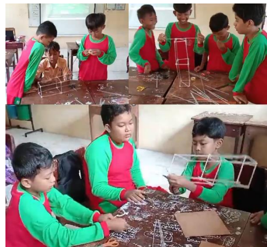
Gambar 2. Aksi Kelompok Peserta Didik Membuat Maket Menara Tahan Gempa Berbahan Sedotan Plastik.

Aksi yang dimaksud dalam pembelajaran ini, yakni kegiatan peserta didik secara berkelompok mengerjakan proyek STEM membuat produk maket bangunan menara tahan gempa berbahan sedotan plastik perwujudan dari gambar desain yang telah dibuat sebelumnya. Peserta didik bekerja sama, berkolaborasi, dan berkoordinasi dengan teman lain dalam satu kelompok untuk menyelesaikan maket menara tahan gempa.