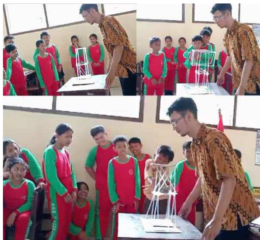
Gambar 4. Uji Produk Maket Menara Tahan Gempa Berbahan Sedotan Plastik.

Berdasarkan hasil diskusi kelompok, semua kelompok menjawab sama pada pertanyaan kelima tentang observasi produk dilihat unsur matematis. Semua kelompok menuliskan bahwa struktur maket bangunan maket menara kebanyakan berbentuk segiempat dan segitiga.