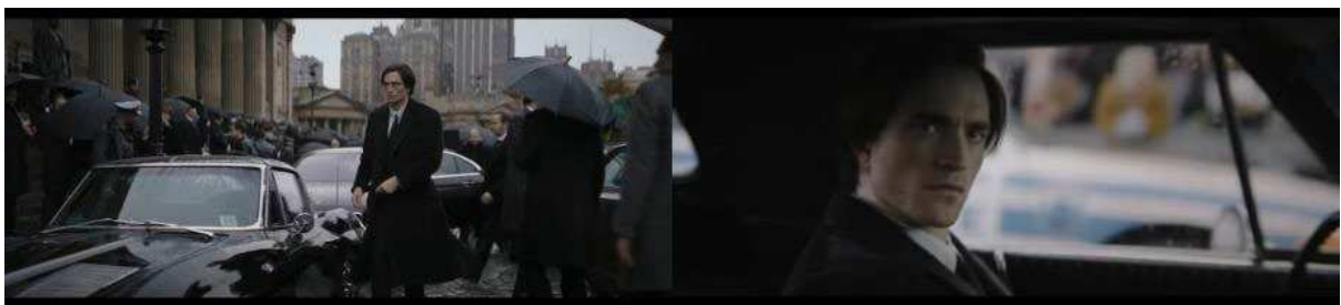
Gambar 2. Bruce Wayne menghadiri penyambutan Walikota baru Gotham.

Berseting waktu pada tahun kedua Bruce Wayne menjadi Batman dan juga seorang detektif, The Batman bermula dengan sebuah kasus kematian yang melibatkan seorang pejabat yang harus dipecahkan oleh dirinya. Di lain sisi, Bruce Wayne yang melabeli dirinya sebagai seorang Vengeance berusaha mencari jati dirinya supaya terlepas dari belenggu kenyataan traumatis yang dialaminya sedari kecil, yakni ditinggal mati oleh kedua orang tuanya.