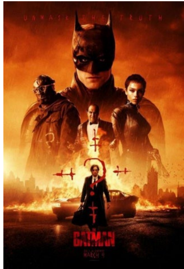
Gambar 1. Cover Film The Batman

Film “The Batman” menjadi objek penelitian. Dengan begitu, akan diungkap berbagai hal dalam film “The Batman. Hal pertama yang akan dijelaskan adalah identitas film “The Batman”. Adapun identitasnya adalah sebagai berikut: