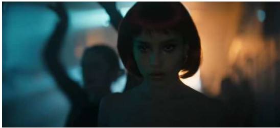
Gambar 5. Cat Woman Menyamar ke Club Berisi para Pejabat

perintah The Batman. Banyak pada pejabat di antaranya Dewan Kota dan Senator yang malah asyik bersenang-senang di club malam dengan pemandangan tarian erotis Wanita.