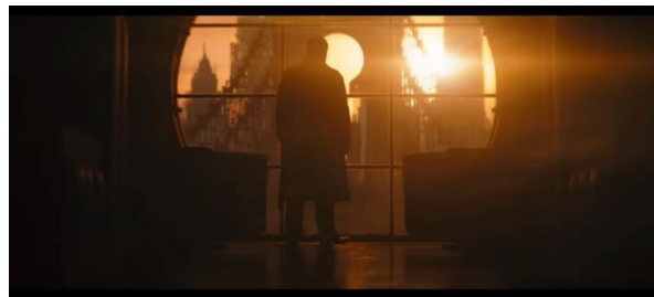
Gambar 4. Penguin Sebagai Salah Satu Mafia Kelas Kakap

kan masyarakat dari perlakuan buruk penegak keadilan.