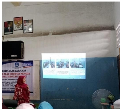
Gambar 3. Tim pengabdian memperkenalkan contoh-contoh alat edukasi yang telah diterapkan di dalam kelas