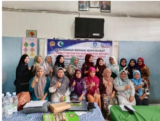
Gambar 5. Foto bersama tim pengabdian dengan guru-guru MIS Nurul Hidayah Medan

Tahapan terakhir dalam kegiatan pengabdian ini adalah tim pengabdian melakukan foto bersama dengan guru-guru di MIS Nurul Hidayah Medan.