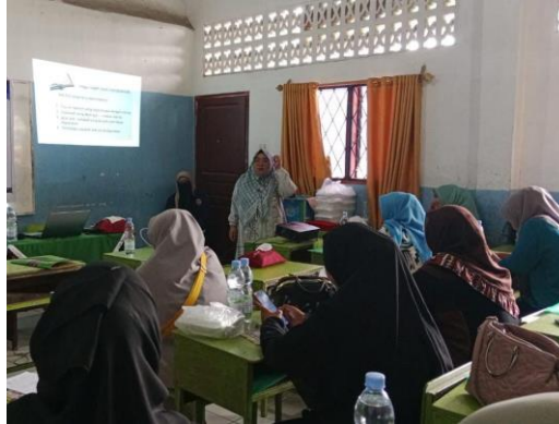
Gambar 2. Guru sedang memaparkan materi di depan peserta kegiatan