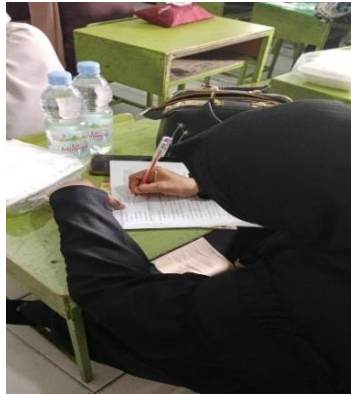
Gambar 1. Guru sedang mengerjakan pre-test