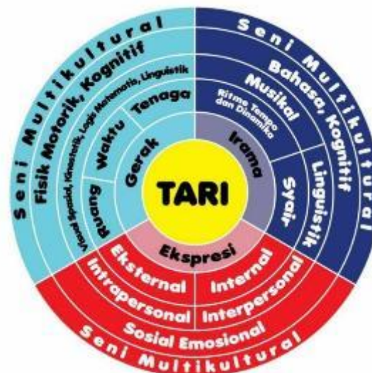
Gambar 1 model spektrum mazeko pembelajaran tari berbasis kecerdasan jamak

Pembelajaran tari berkaitan erat dengan konsep kecerdasan jamak, sebuah isu yang sering diperbincangkan di masyarakat. Tari untuk anak-anak tidak hanya melibatkan kecerdasan kinestetik, spasial, dan musikal, tetapi juga aspek logis-matematis, linguistik, serta kecerdasan interpersonal dan intrapersonal. Melalui pembelajaran tari, berbagai jenis kecerdasan ini dapat diintegrasikan, memungkinkan anak untuk mengembangkan kemampuan mereka secara holistik. Isu pembelajaran tari yang berfokus pada kecerdasan jamak ini dapat diilustrasikan dalam model berikut yang menggambarkan keterkaitan antara berbagai kecerdasan dalam proses pembelajaran tari.