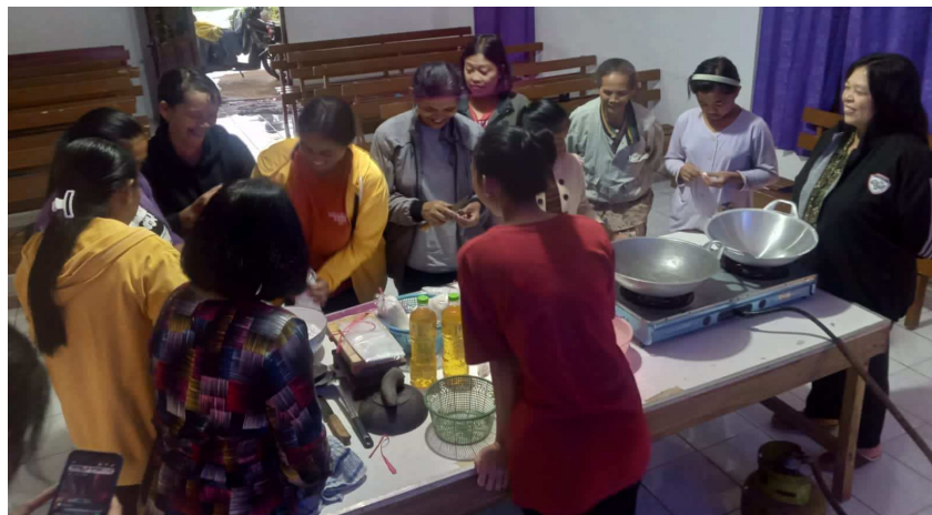
Gambar 3: Pelatihan Pembuatan Keripik Tempe

Gambar 2 menunjukkan materi disampaikan kepada peserta dengan penuh antusias. Meskipun cuaca hujan namun peserta tetap antusias. Ekspresi peserta menunjukkan kesungguhan. Materi dapat menjadi landasan setiap orang Kristen dalam menjalankan bisnis maupun wirausaha dengan standar kebenaran atau dengan integritas yang ditunjukkan dari resep, kualitas bahan, cara mengatur harga, cara mempromosikan yang tidak menipu, dan pengalokasian modal. Landasan yang disampaikan dalam materi adalah motivasi luhur yang sesuai dengan prinsip Alkitab dalam berbisnis atau wirausaha.