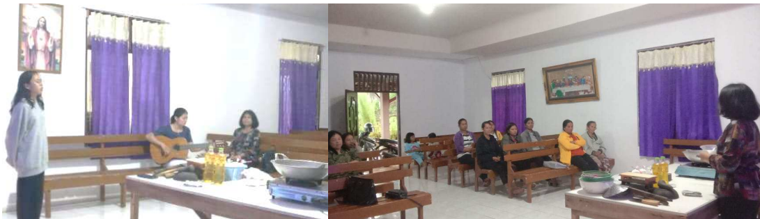
Gambar 1: Penyampaian Materi

Bagian yang dapat dilihat dan menjadi ukuran tercapainya tujuan kegiatan ini adalah pada antusiasme peserta mengikuti seminar dan pelatihan, seluruh materi dapat tersampaikan dengan baik dan dipahami oleh peserta, keripik tempe dapat diproduksi oleh peserta. Hal ini juga tidak terlepas dari berbagai kendala pada pelaksanaan kegiatan. Kendala dalam pelaksanaan kegiatan ini adalah cuaca yang kurang mendukung dan ketersediaan bahan pembuatan keripik tempe, sehingga kegiatan ini mengalami keterlambatan waktu sekitar satu jam. Cuaca kurang mendukung membuat tempe tidak dapat langsung di goreng. Namun hal tersebut masih dapat teratasi.