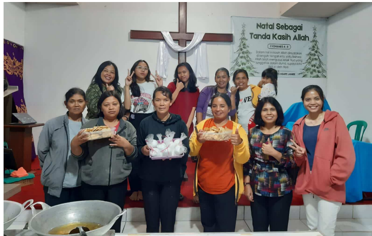
Gambar 4: Apresiasi Unjuk Hasil

mengaplikasikan resep ataupun petunjuk pembuatan. Kemudian mahasiswa dan pembicara sebagai tim, bersedia membantu peserta dalam pengarahan-pengarahan. Terdapat peserta yang bertanya secara teknis; “mengapa tempe yang digoreng harus satu persatu?” pertanyaan tersebut dijawab bahwa supaya keripik tempe dapat digoreng dengan maksimal dan tidak lengket antara tempe satu dengan yang lainnya dan dapat digoreng dengan kering sempurna supaya tidak mudah basi.