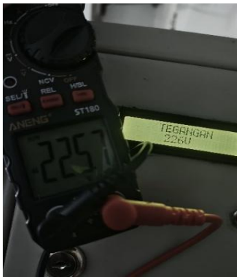
Gambar 3. Hasil Pengujian Tegangan

Berdasarkan hasil pengujian pada Tabel 1 diatas, yang dilakukan dengan alat bantu tang ampere pada gambar 2, serta hasil pada tampilan LCD, diperoleh perhitungan nilai akurasi untuk memvalidasi konsistensi dan ketepatan pembacaan sensor.