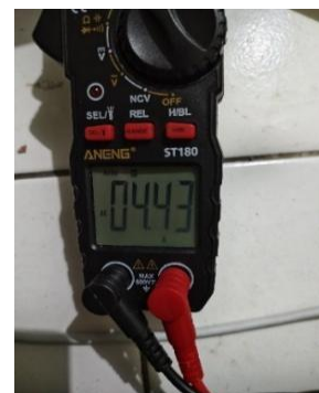
Gambar 9 Pengukuran saat Arus berlebih