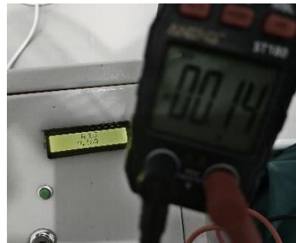
Gambar 4. Hasil Pengujian Arus

Berdasarkan hasil pengujian pada Tabel 2 diatas yang dilakukan dengan alat bantu tang ampere pada gambar 3 dan hasil pada tampilan LCD didapatkan perhitungan nilai akurasi guna memvalidasi konsistensi dan keakuratan dari pembacaan sensor.