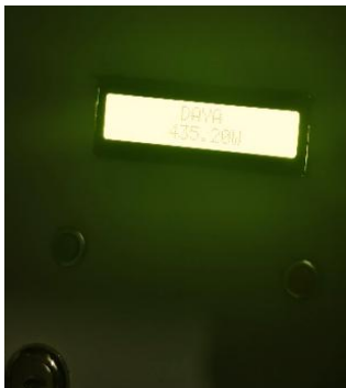
Gambar 5. Hasil Pengujian Daya Listrik

Pada tabel 3, perhitungan daya yang dilakukan yaitu perhitungan daya semu dengan rumus P = I \times V yang mana menjelaskan bahwa hasil perhitungan daya pada tabel 3 didapat dari nilai arus dan tegangan yang terbaca pada alat ukur tang ampere. Daya semu mengukur total daya yang diperlukan oleh rangkaian listrik untuk mengalirkan arus melalui perangkat listrik atau beban.