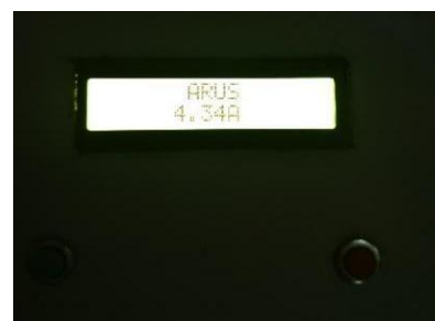
Gambar 8 Tampilan Arus Berlebih pada Alat

Pengujian arus berlebih dilakukan untuk mengetahui adanya beban berlebih pada saat sistem running yang ditandai dengan alarm buzzer yang berbunyi pada saat kondisi beban lebih dari 4A. Pada gambar 8 dibawah terdapat nilai arus sebesar 4.34A yang divalidasi oleh alat ukur tang ampere pada gambar 9 dengan hasil pengukuran sebesar 4.43A. Saat terjadi kondisi arus berlebih seperti pada gambar 8 dan gambar 9 di bawah, secara otomatis alarm buzzer akan menyala dan relay akan memutus listrik ke beban.