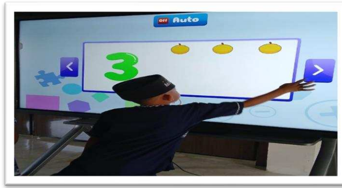
Gambar 4.3 Pembelajaran Inovatif Dalam Eksplorasi Matematika Melalui Smart TV