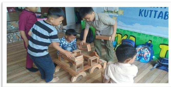
Gambar 4.1 Pembelajaran Inovatif Melalui Bermain Balok

anak usia dini (Julianti,dkk., 2023). Adapun strategi pembelajaran inovatif dan berdiferensiasi melalui penyusunan balok mainan, terlihat pada gambar 4.1, sebagai berikut :