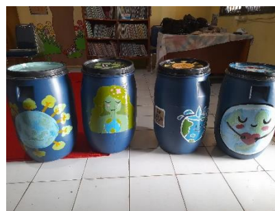
Gambar 7 Hasil kegiatan

Setelah kegiatan melukis tong sampah selesai, tong sampah tersebut dijemur di bawah terik matahari beberapa jam, hal ini bertujuan untuk mengeringkan cat sehingga tidak saling menempel. Hasil dari tong sampah berjumlah empat buah yang akan ditaruh di letakan di beberapa kelas . Adapun karakter yang digambar para siswa bertemakan bumi dimana ada gambar bumi dengan air yang melimpah, ada seorang dewi yang melindungi bumi, serta ada bumi yang memeluk dirinya sendiri dengan ditambahkan icon hati yang menandakan bahwa manusia harus mencintai bumi.