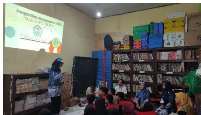
Gambar 3 Pembukaan oleh Widya Nuriyanti