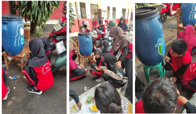
Gambar 6 Proses kegiatan melukis tong sampah

membangun karakter mencintai lingkungan. Pada kegiatan ini pihak sekolah sedan gada mahasiswa KM (kampus mengajar) dimana tim dibantu oleh para mahasiswa untuk melancarkan jalannya kegiatan. Sebelum memulai kegiatan melukis para siswa dibagi menjadi empat kelompok dimana masing – masing kelompok terdiri dari 7 siswa yang akan bekerjasama dalam melukis tong sampah. Di dalam kegiatan tersebut pertama – tama tong sampah akan dibuat sketsa lebih awal. Tim PKM membuat sketsa gambar terlebih dahulu untuk mempermudah para siswa melukis tong sampah tersebut, kemudian Tim juga membantu para siswa dalam pencampuran warna tersebut. Selama pendampingan melukis tong sampah siswa diarahkan secara teknik dalam melakukan pengecatan tong sampah, karena tong sampah terbuat dari bahan plastik dan cat yang digunakan ialah cat minyak. Melukis di bahan plasik dengan menggunakan cat minyak memang agak sedikit sulit karena sifat cat minyak yang sulit melekat pada bahan plastic, namun hal ini sudah dipertimbangkan penggunaan cat minyak jauh lebih baik daripada menggunakan cat lain, karena cat minyak tidak akan luntur apabila terkena oleh air tentu saja hal ini menjadi pertimbangan besar oleh tim mengingat tong sampah akan diletakan di ruang terbuka sehingga akan terkena hujan dan panas secara langsung.