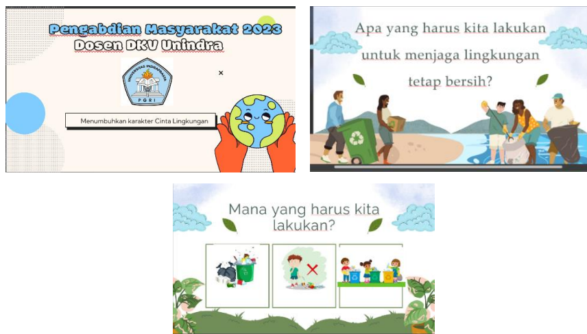
Gambar 5 Materi PPT sosialisasi

Setelah sosialisasi selesai Bu Martha Tisna salah satu anggota tim memberikan penjelasan bagaimana cara melukis nanti dilapangan. Diberikan macam-macam warna, bagaimana menciptakan warna baru dari mencampurkan aneka warna dasar ( kuning, biru , merah) kemudian bagaimana cara melukis, bahan dan alat yang akan digunakan sudah disiapkan oleh Tim sehingga para siswa bisa langsung mengkreasi ide mereka dalam bentuk melukis tong sampah.