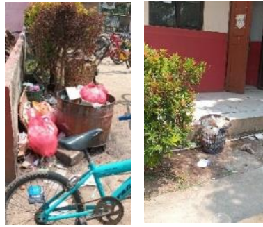
Gambar 1 Tempat Sampah Lama

Dalam permasalahan ini sekolah membutuhkan media yang mudah dibuat dan dalam bentuk kegiatan yang menyenangkan. Kegiatan yang menyenangkan akan mudah diingat oleh para siswa. Tong sampah yang dilukis dalam bentuk yang menarik serta ditulis dalam ujaran positif akan selalu dibaca siswa yang berada di sekolah sebagai upaya dalam membentuk karakter siswa dan kesadaran peduli lingkungan. Sikap sadar tersebut merupakan sikap tanggap dan mampu memberikan solusi pada isu-isu lingkungan (Kusumaningrum, 2018). Berdasarkan paparan latar belakang tersebut serta penelitian sebelumnya maka tujuan dari kegiatan ini adalah menumbuhkan rasa kepedulian siswa terhadap lingkungan melalui kegiatan melukis tong sampah.