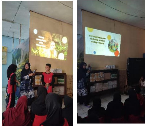
Gambar 4 Sosialisasi kepada siswa