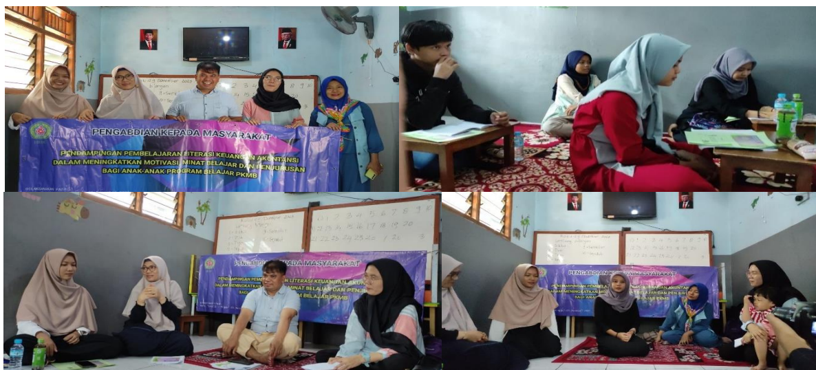
Gambar 2. Kegiatan bimbingan belajar di PKBM Inovatif Cibinong

Hasil dari kegiatan pengabdian ini berupa pendampingan siswa melalui kegiatan bimbingan pembelajaran dengan materi Akuntansi dan Keuangan serta pemberian motivasi berupa pembekalan terkait memasuki dunia kerja dan dunia kampus yang dilaksanakan di PKBM Inovatif Cibinong. Kegiatan pengabdian ini merupakan salah satu program pengabdian masyarakat bagi dosen sebagai upaya pelaksanaan tri dharma perguruan tinggi. Kegiatan pengabdian kepada masyarakat ini memberikan banyak manfaat, wawasan dan pengetahuan kepada anak-anak di PKBM Inovatif Cibinong, terutama dalam meningkatkan pemahaman laporan keuangan dan motivasi belajar. Pelaksanaan kegiatan bimbingan belajar ini menggunakan 5 tahapan, yaitu: (1) Pemaparan materi mengenai akuntansi dan keuangan, (2) Ice Breaking (3) tanya jawab, (4) Permainan berupa kuis yang menarik, pemotivasian siswa dalam belajar melalui motivasi berorientasi materi (5) motivasi tentang kehidupan berupa pembekalan ketika nanti memasuki dunia kerja dan dunia kampus, (6) pemberian reward (hadiah) berupa pujian/penghargaan secara lisan dan berupa barang.