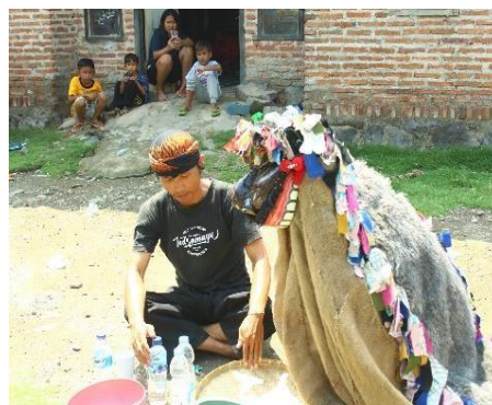
Gambar 3. Pertunjukan Berokan

Berokan merupakan salah satu kesenian yang di dalamnya terdapat sejarah dan pesan-pesan ajaran keagamaan khususnya ajaran agama Islam. Akan tetapi saat ini Seni Berokan menghadapi tantangan pelestarian karena kurang dikenal terutama generasi muda. Dalam upaya pencegahan hilangnya warisan budaya ini, diperlukan media informatif yang mampu menyajikan data secara lengkap, kreatif, dan menarik. Media ini penting untuk menjembatani kesenjangan antara seni tradisional dan generasi muda, sehingga mereka dapat mengenal, menghargai, dan melestarikan seni Berokan sebagai bagian dari identitas budaya lokal. Media yang digunakan adalah media yang memiliki karakteristik antara lain: memuat data informasi lebih lengkap (detail) serta memiliki banyak kemungkinan untuk ditampilkan secara kreatif, sehingga dapat menarik perhatian pembaca. Gambar 3 menampilkan salah satu adegan dalam pertunjukan Berokan Indramayu yang melibatkan penari, penata tari, dan tim lainnya.