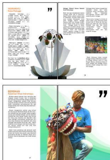
Gambar 11. Desain halaman isi

Bagian isi dari buku informasi Kesenian Berokan Indramayu menampilkan gambar dan deskripsi mengenai informasi mengenai Indramayu hingga sejarah dari Kesenian Berokan Indramayu berdasarkan hasil penelitian. Teknik visual yang digunakan yaitu fotografi. Gambar 11 menampilkan beberapa halaman dari isi buku Berokan Kesenian Indramayu.