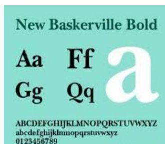
Gambar 8. Penggunaan Font Baskerville Bold

Tipografi merupakan ilmu dan seni dalam merancang maupun menata aksara dalam kaitannya untuk menyusun publikasi visual, baik cetak maupun non-cetak (Kusrianto, 2020: 1). Dalam dunia desain, tipografi disebut sebagai ‘visual language’ yang diartikan sebagai bahasa yang dapat dilihat. Dalam perancangan sebuah desain, tipografi sangat memengaruhi susunan hierarki dan keseimbangan sebuah karya desain untuk itu pemilihan jenis huruf harus diperhatikan. Pemilihan jenis huruf dalam buku informasi seni Berokan ini mempertimbangkan dua faktor utama yaitu kesesuaian dengan karakter seni Berokan dan kenyamanan pembaca, terutama audiens muda. Kombinasi antara serif fonts untuk judul, sans-serif fonts untuk body text , dan display fonts atau dekoratif untuk elemen artistik akan menciptakan keseimbangan antara estetika visual dan fungsionalitas, sehingga informasi tentang seni Berokan dapat disampaikan secara efektif dan menarik. Jenis huruf yang digunakan oleh peneliti dalam perancangan buku informasi kesenian Berokan Indramayu adalah jenis font New Baskerville Bold yang ditampilkan pada gambar 8. Font ini Huruf dengan gaya serif dapat memberikan kesan formal dan tradisional yang sesuai dengan karakter budaya seni Berokan yang kaya akan nilai sejarah. Hal ini juga memberikan kesan kuat dan elegan pada bagian judul dan heading buku.