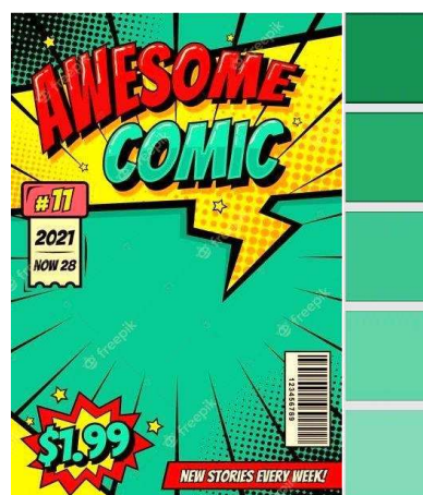
Gambar 7. Moodboard skema warna

Warna juga termasuk salah satu konsep desain komunikasi visual dalam pembuatan buku informasi. Warna dapat didefinisikan secara objektif atau fisik sebagai sifat cahaya yang dipancarkan atau secara subyektif atau psikologis sebagai bagian dari pengalaman indra penglihatan (Nugroho, 2018: 22).