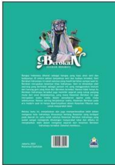
Gambar 12. Desain Penutup dan Sampul belakang