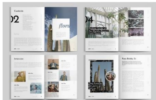
Gambar 6. Moodboard tata letak

Konsep buku informasi Kesenian Berokan Indramayu menggunakan konsep gaya visual, diantaranya mencakup foto, gambar, warna, huruf, dan elemen lainnya yang mendukung pada tampilan desain. Foto dan juga konten informasi yang dipadukan secara bersama, bertujuan untuk memberikan gambaran sekaligus penjelasan untuk memberikan informasi yang jelas kepada pembaca. Gambar 6 merupakan moodboard tata letak yang digunakan dalam perancangan buku informasi Kesenian Berokan Indramayu.