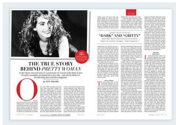
Gambar 9. Tata letak Column Grid

Layout merupakan tata letak elemen-elemen desain terhadap suatu bidang dalam media tertentu untuk mendukung konsep atau pesan yang dibawanya. Pada prinsipnya, tujuan utama layout adalah menampilkan elemen gambar dan teks agar menjadi komunikatif dalam sebuah cara yang dapat menerima informasi yang disajikan (Pabrik, 2020). Dalam perancangan buku informasi Kesenian Berokan Indramayu menggunakan grid system yang menerapkan jenis Column Grid yang ditampilkan pada gambar 9. Column Grid adalah sebuah grid system yang menggunakan kolom-kolom secara vertikal. Column Grid membantu menciptakan struktur yang jelas dalam penyusunan teks dan gambar. Dengan membagi halaman menjadi kolom-kolom vertikal, pembaca dapat lebih mudah mengikuti alur informasi. Dalam buku informasi, terutama yang berisi teks dan gambar tentang seni Berokan, penggunaan kolom memudahkan pemisahan konten seperti penjelasan tentang sejarah, kostum, atau pertunjukan secara terorganisir.