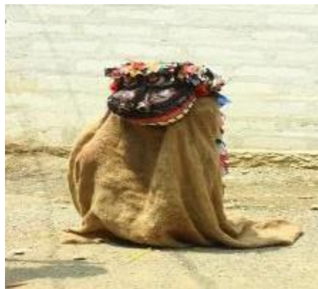
Gambar 1. Berokan Indramayu

Seni Berokan bukan hanya sekadar seni pertunjukan, tetapi juga dianggap sebagai sarana untuk menolak bala, yakni mencegah bencana, bahaya, penyakit, dan lain-lain, melalui mantra kenduri dan sejenisnya. Kepercayaan masyarakat Indramayu yang kuat terhadap kekuatan yang mengendalikan alam semesta mendorong terciptanya seni ini, yang tidak hanya berfungsi sebagai hiburan, tetapi juga sebagai perantara doa kepada Tuhan Yang Maha Kuasa agar dijauhkan dari berbagai musibah, penyakit, dan bencana. Seni Berokan tidak hanya berkembang di Indramayu, tetapi juga tumbuh di Cirebon.