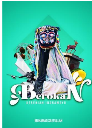
Gambar 10. Desain sampul buku Berokan Indramayu

judul Kesenian Berokan Indramayu. Gambar 10 menampilkan desain sampul buku Berokan Kesenian Indramayu.