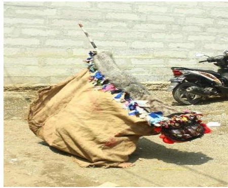
Gambar 2. Bentuk Berokan

Makna dari Berokan yang dianggap sebagai penolak bala, melihat ke dalam dari tolak bala itu sendiri, memang tidak bisa lepas dari keyakinan bahwa ada suatu tangan besar yang mengatur segala kehidupan. Semua bergantung pada kekuatan itu untuk ketenangan dirinya sendiri, keluarganya, kelompoknya ataupun masyarakat di desa tersebut yang mana banyak hal baik yang bisa diambil dari adanya pertunjukan Berokan itu sendiri. Dalam kesenian Berokan sebagai kesenian yang diyakini menolak bala atau musibah dan juga media sebagai syiar agama itu sudah cukup erat pada kesenian yang berasal dari Indramayu tersebut. Gambar 2 menampilkan bentuk tarian yang dilakukan seorang Penari yang biasanya memegang atau menggerakkan berokan (dalam tarian mereka sepanjang pertunjukan).