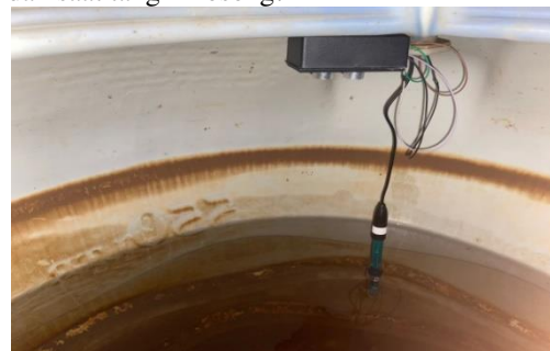
Gambar 2. Implementasi Sensor Ultrasonik Pada Tangki