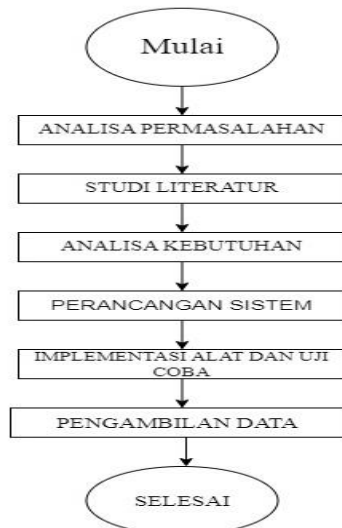
Gambar 1. Perencanaan Studi Penelitian

dimana tujuan implementasi alat dilakukan untuk menyelesaikan masalah serta tujuan uji coba alat ini adalah untuk menentukan apakah alat yang telah dibuat telah berfungsi dengan baik dan sudah sesuai dengan perancangan atau belum. Pengujian pada alat ini meliputi pengujian setiap blok maupun pengujian secara keseluruhan. Setelah melakukan uji coba alat proses terakhir yaitu pengambilan data.