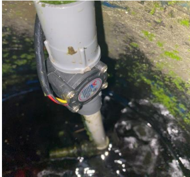
Gambar 3. Implementasi Water Flow Sensor

Data dari sensor dikirimkan ke platform IoT menggunakan modul komunikasi Wi-Fi(ESP 32). Platform IoT yang digunakan adalah Blynk, yang memungkinkan pengguna untuk memantau data secara real-time melalui aplikasi web atau mobile. Data yang dikumpulkan antara lain ketersediaan(ketinggian) air dan penggunaan air(debit) Air.